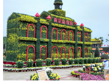
菊花造型南京總統府

這次在整個活動過程中，我個人感受到主辦單位對先祖孫中山先生真誠的敬仰，用最高的水準服務來接待嘉賓，在此我僅代表孫家親屬獻上衷心的感謝！