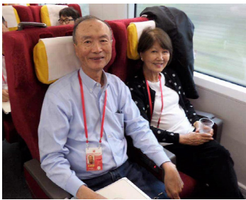
乘高鐵從北京到南京

翌日到訪中山陵，從陵前博愛坊至陵門，至碑亭，至祭堂一共有台階392級，做完了這個早晨運動後，嘉賓團集合在祭堂內進行晉謁并獻花籃儀式。原來孫中山希望去世後被葬於紫金山原因有二：1) 1912年3月，孫中山與胡漢民等人到紫金山打獵，他看到這裡背負青山，前臨平川，氣勢十分雄偉，笑對左右說：“待我他日辭世後，願向國民乞此一抔土，以安置軀殼爾。” 2) 1925年3月孫中山臨終前對宋慶齡、汪精衛等人說：“吾死之後，可葬於南京紫金山麓，因南京為臨時政府成立之地，所以不可忘辛亥革命也。”