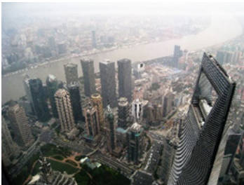
上海中心觀光層俯瞰金融中心

黃浦江的夜景的確是不同凡響，外灘和浦東兩岸的大廈爭相鬥艷、人潮、船潮、車潮不斷，給我聯想起著名歌星周璇的一曲“夜上海夜上海你是個不夜城…”。