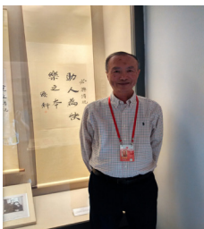
叔父孫科手題字幅

在最後活動那天，嘉賓團首先到訪翠亨村孫中山故居參加晉謁并獻花籃儀式，繼後乘車赴文化藝術中心出席《我們的孫中山》大型交響音樂會。這部作品是由「序曲」、「故鄉與海」、「辛亥風雲」、「共和曙光」、「頌歌」樂章構成，講述孫中山一生命、革命、使命的故事。音樂會通過交響樂形式，記念孫中山傑出的歷史功勳，激發人們為實現中華民族偉大復興而努力奮鬥。