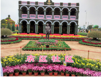
菊花造型孫中山故居

第二天我們乘車往小欖參觀小欖菊花會，據悉小欖人愛菊、種菊，賞菊因而有“菊城”的美譽。歷史上每逢菊花盛開時，各家族將各種菊藝擺設在一起評比高下，後來發展為菊花會，並定下“60年一次大展，10年一次小展，每年一展。”菊花會以“自然、人文、花海、菊城”作為特色，以菊花造景為主。今年乘孫中山誕辰150周年喜慶，小欖菊花會以26個菊花造景展示了孫中山主要革命歷史足跡及歷史建築。聞說過十天後全部菊花盛開時，所有造景的菊花顏色會顯得更鮮艷。