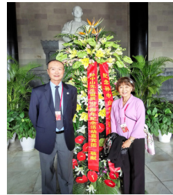
中山陵祭堂內獻花致敬

從南京乘高鐵到上海需1小時39分。抵達後嘉賓團先到訪孫中山故居和宋慶齡故居，繼後參觀浦東上海中心大廈。這座大廈高達2,073英尺，僅次於世界第一高樓迪拜哈利法塔（2,722英尺），與浦東區環球金融中心（1,614英尺）、金茂大廈（1,380英尺）一起成為上海新地標。嘉賓團先到大廈119層觀光平台上俯瞰上海市全貌，隨後參觀位於37層的觀復博物館，館內設有四個固定展廳：瓷器館、東西館、金器館、造像