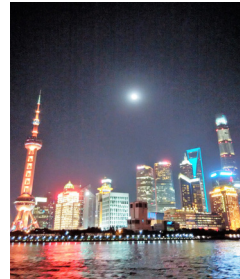
黃浦江上盈月普照浦東

次日嘉賓團坐包機到達廣州，隨即到中山紀念堂參加晉謁并獻花籃儀式，其後參觀孫中山大元帥府紀念館。30多年前，叔父孫科（孫中山長子）給我題字「助人為快樂之本」的一卷字幅，年前我委托本館暫代保存，這次在陳列室內也看到了。