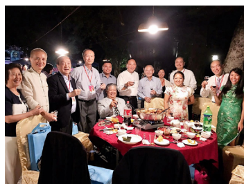
孫中山故居前廣場孫府晚宴