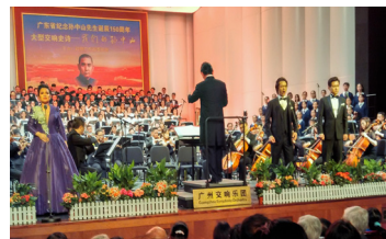
《我們的孫中山》大型交響音樂會