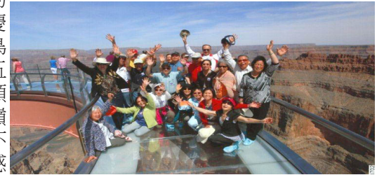
Grand Canyon Skywalk

五年前在香港母校舉行的金禧重聚及往參觀省澳母校的餘慶回到半世紀前的「老巢」那種「鳥倦知還時」的情景，歷歷如昨。五年中我們從「七十尚不足，六十頗有餘」的年齡步向八十、九十的巔峰，心中不由自主地有點「高處不勝寒」和那「近鄉情更怯」的感覺。