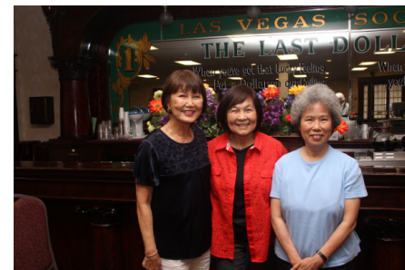
又見面了，還是活力非凡啊！