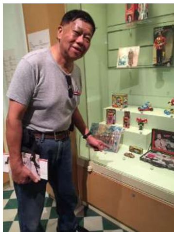
筆者攝於香港文化博物館