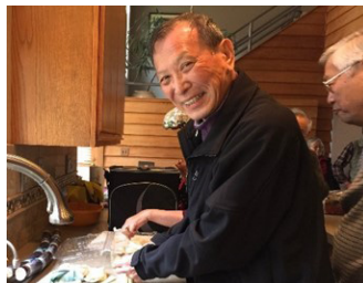
筆者在切甘蔗成小塊易於入口