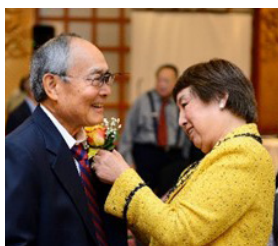
梁太給常廣原戴上蘭花