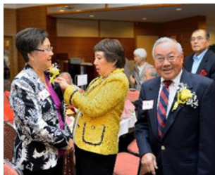
梁太為章以洵戴上蘭花