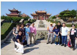
路 環 媽 祖 廟