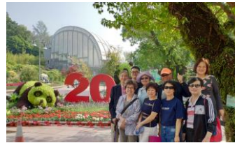
熊 貓 館