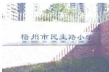
梧州市民主路小學