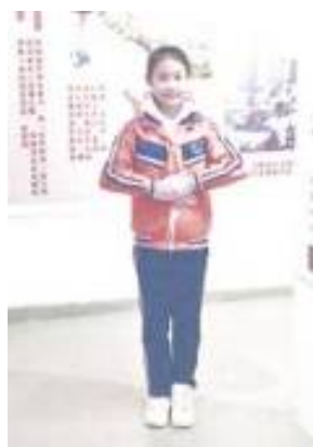
文質彬彬，可愛有禮及講解清晰的小朋友講解員