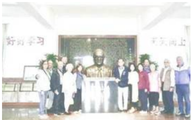
在鄭文熾學長銅像前合照