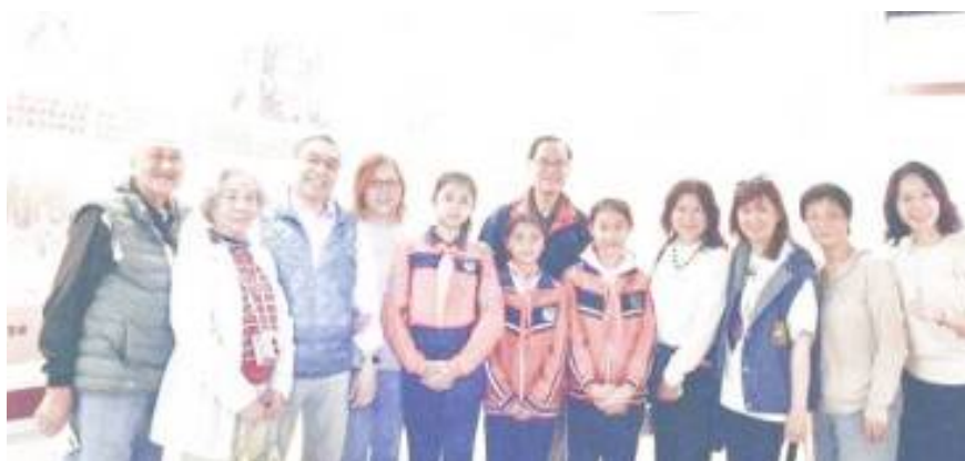
講解完畢，團員們都爭相與訓練有素、彬彬有禮的講解員合照！