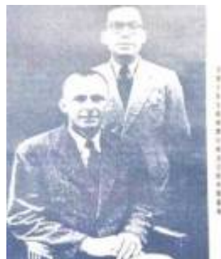
華里士醫生與黃啟信醫生？