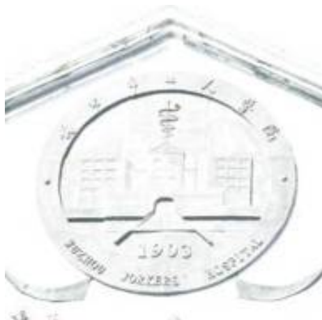
建於1903年的原思達醫院大樓（現被列為古蹟，不再使用）