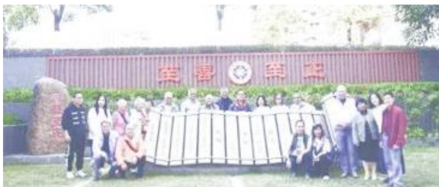
參觀完校史室，在小操場旁的至善至正及校歌裝飾前與校長及會長們合照