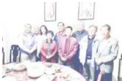
各地恆社同學與岑校長、江會長等合照

2024年12月2號，我們參觀完梧州工人醫院、梧州培正學校及一些名勝後，這次的參訪台山培正及梧州培正之旅亦告完滿結束，當晚夜宿梧州市內的一間新型設計旅館。