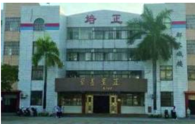
紀念鄭文熾學長大樓