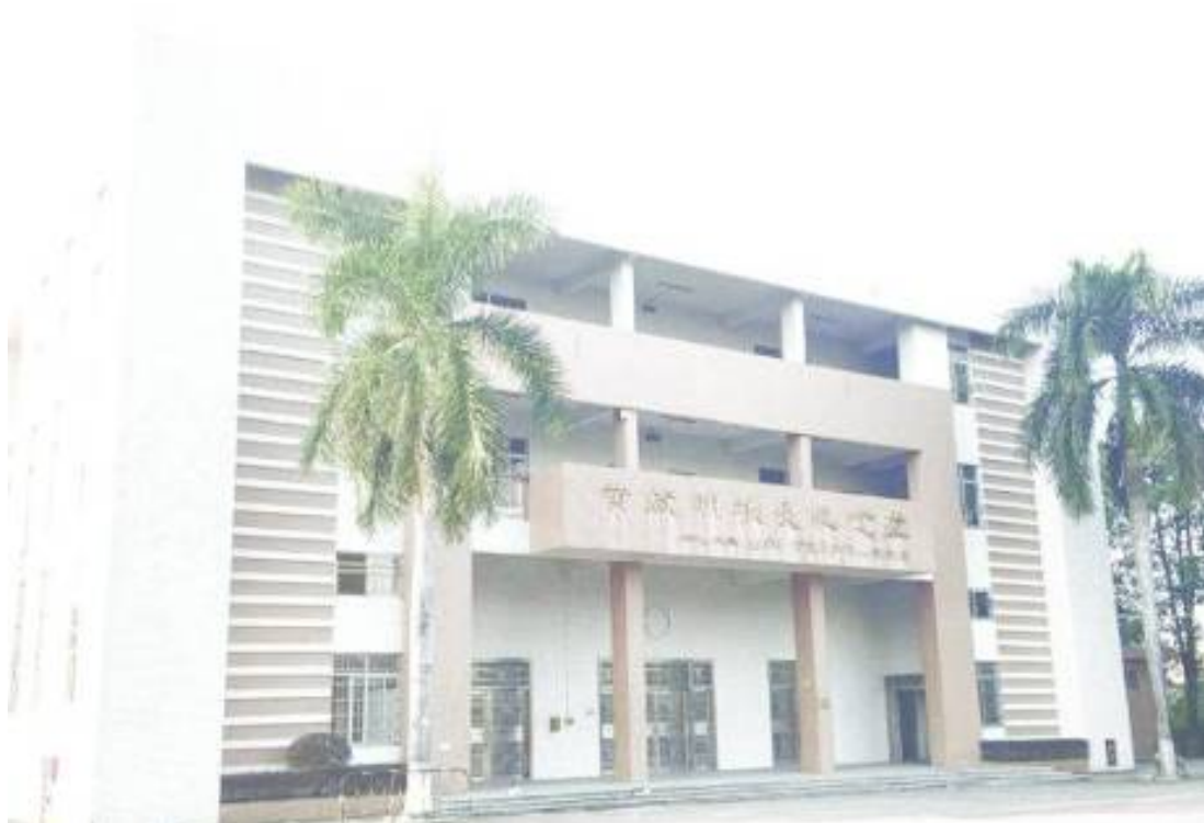
黃啟明校長紀念堂