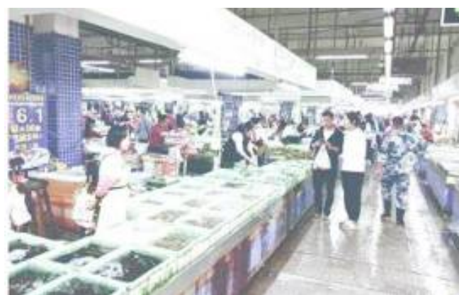
白藤頭水產批發市場