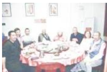
參觀完嶺南文化園，天色漸黑，晚餐就是在文化園旁邊的「桂菜粵北餐館」嘗試廣西菜式，其中最具特色之一，乃是這裡的馳名紙包雞。