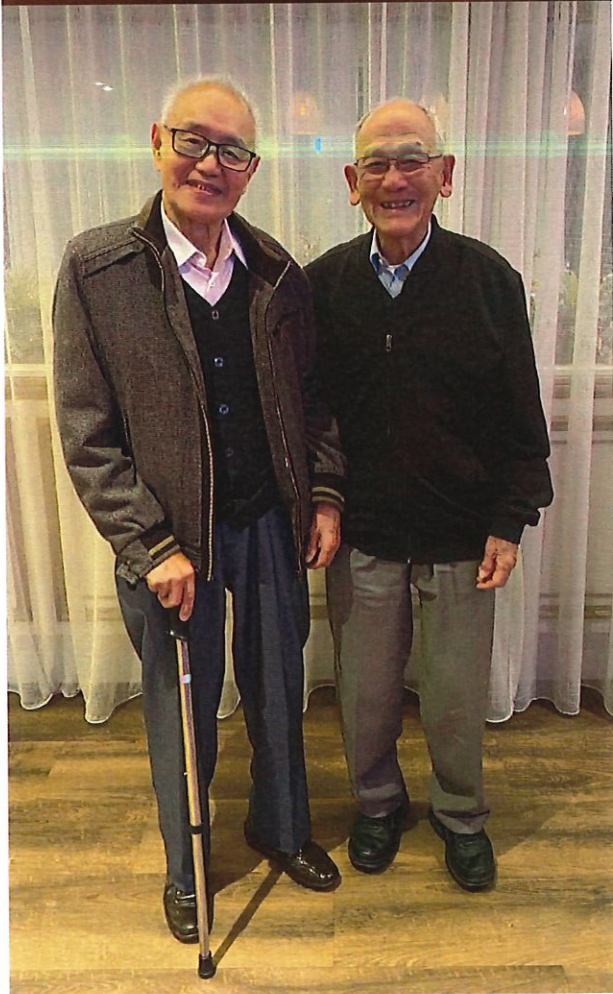
DINNER AT CASTLE HILL TERRACE SUNDAY, 11.6.2023

胞, 3. 健康的血糖, 血壓和血脂指數, 4. 減肥. 5. 減炎症 6. 減糖尿病用藥和胰島素阻抗.