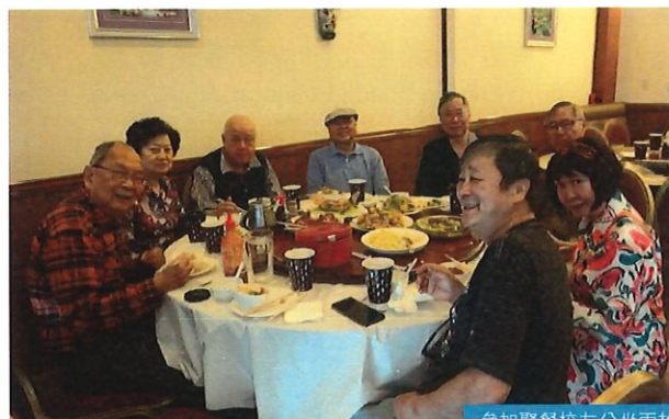
參加聚餐校友分坐兩枱