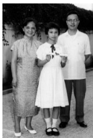
圖三張老師全家照