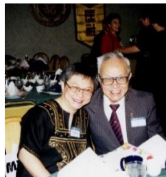
圖四張老師父女相依為命