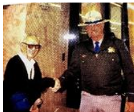
圖六張老師和美國加州首府警衛握手