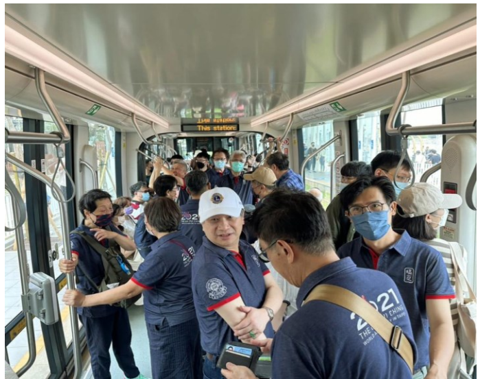
(左)高雄港旁培正學長的设计 (右) 在高雄轻轨内