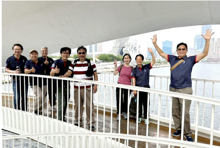
高雄港大港橋 (旋轉橋)