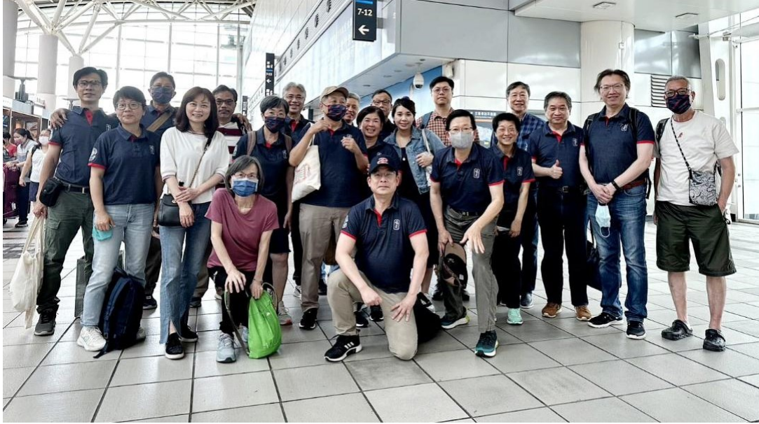
合照後 浩浩蕩蕩的出發