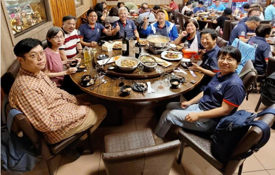
高雄阿蓮區的田野香雞庭園