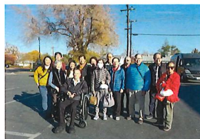
全體十四人臨別前合影