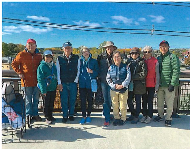
攝於新建的步道人天橋上