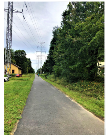
MASS CENTRAL RAIL TRAIL 步道