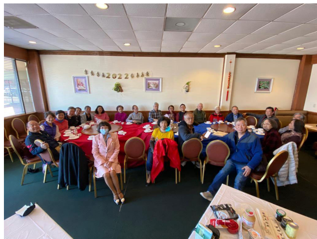
HOUSTON 春茗，特別自備紅藍枱布