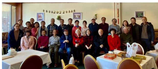
全體參加同學合照