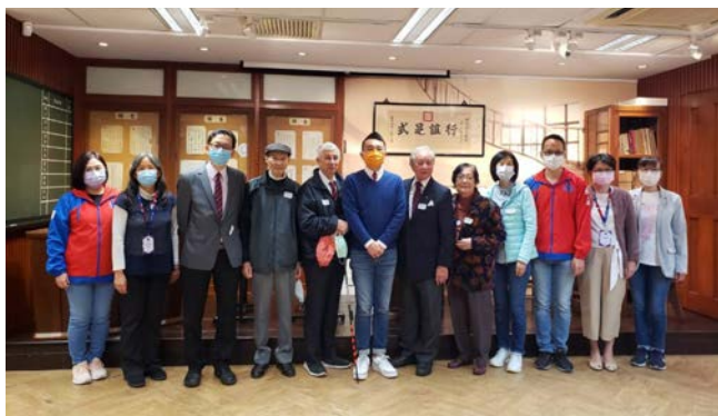
弘社及中、小學正、副校長合照