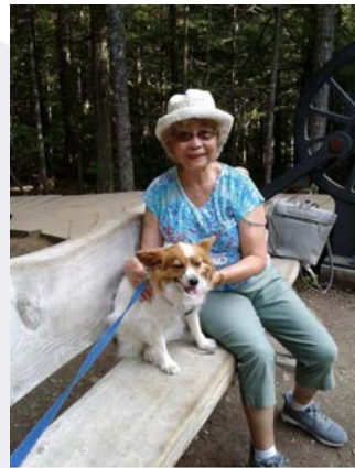
With my granddog Romeo

“Arthritis: what exercise work” by Dava Sobel & Arthur C. Klein which outlines simple exercise for joints from neck to toes, the info helps me with daily exercise which has been effective in relieving both joint and muscle pain. She also