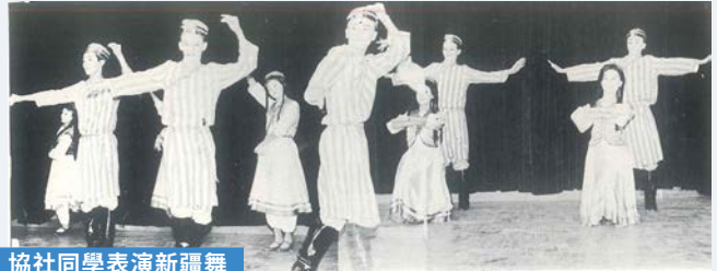
協社同學表演新疆舞