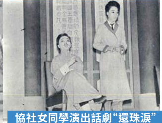
協社女同學演出話劇“還珠淚”