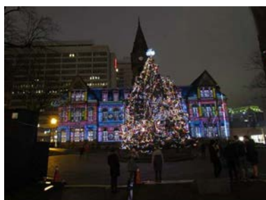
Christmas Tree in Grand Parade and Holiday light show on City Hall, downtown Halifax