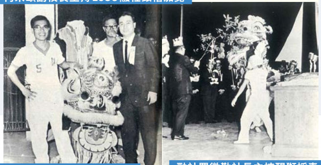
協社醒獅與司徒英會長合照