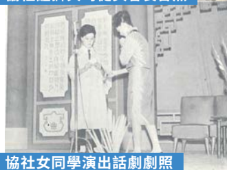
協社女同學演出話劇劇照