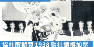
協社醒獅賀1938融社銀禧加冕