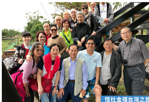
恆社金禧台灣之旅