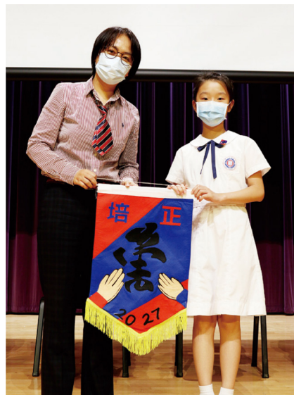
培正同學會將口罩頭帶贈送給崇社同學