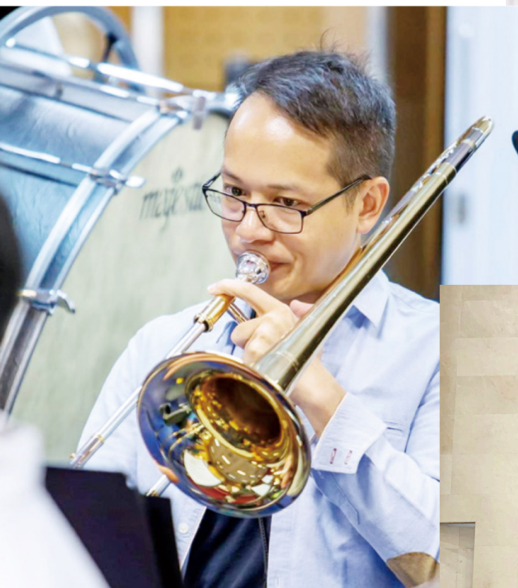
葉校長擅長吹奏長號