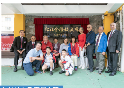
仁社社友及家屬合照