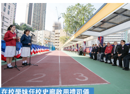
在校學妹任校史廊啟用禮司儀