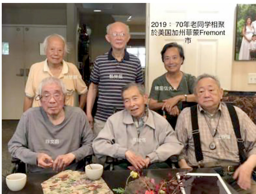
2019年70年老同學相聚於美國加州菲蒙FREMONT市