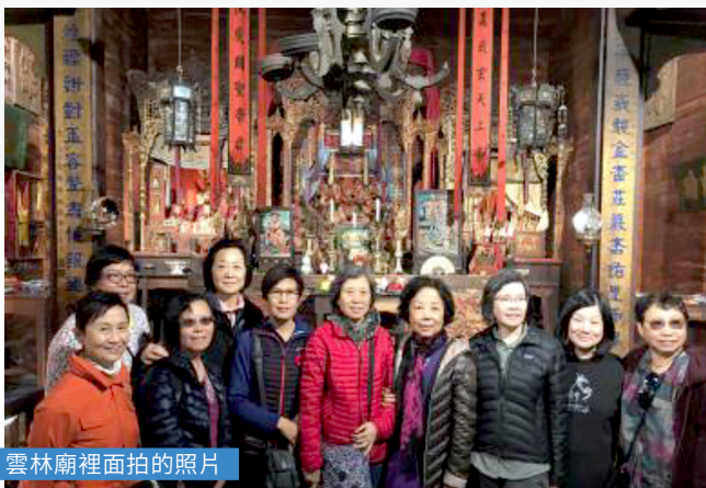
雲林廟裡面拍的照片

早餐後，前往參觀在 Myers Flat 的 Giant Shrine Drive Through Tree，車程兩個多小時，途中各人自我表述過去五十年中生活體驗。大家用詞幽默無比，聽者無不捧腹，笑