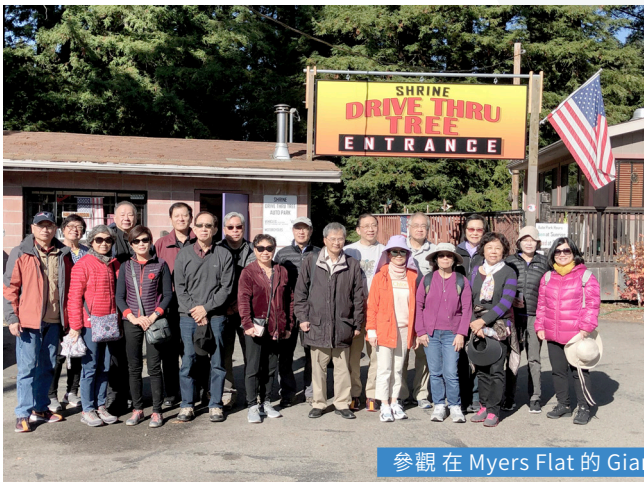
參觀在 Myers Flat 的 Giant Shrine Drive Through Tree

昇社在北美慶祝金禧的活動是在11月4日展開序幕，當晚在 Millbrae 的彩蝶軒酒樓舉行晚宴，負責籌備的同學，首