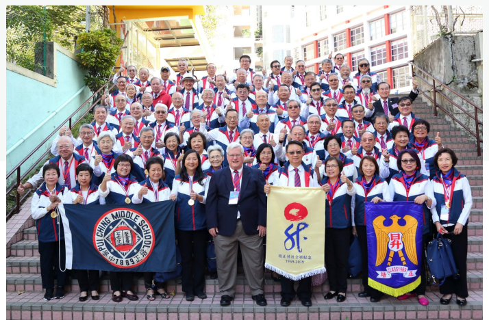
金禧大樓梯團體照