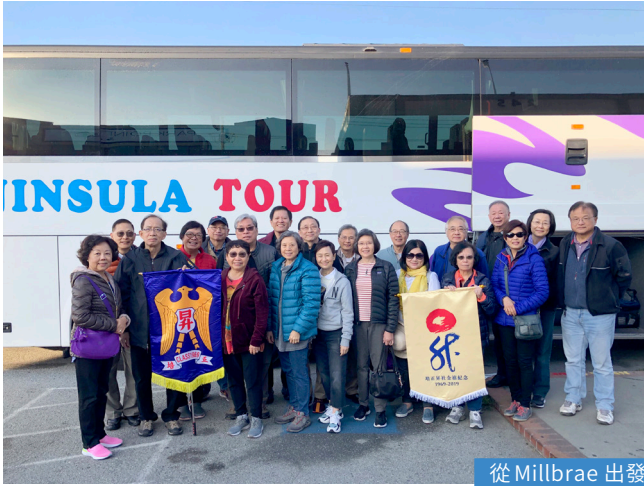
從 Millbrae 出發