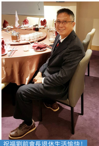
祝福劉前會長退休生活愉快!

面可能有些小混亂，要請各位諒解會長招呼不周、主持不力，會長總是希望能讓年輕人參加聚會有所獲益，所以在沒有預先通知的情況之下，隨機點名了幾位校友，請他們分享自己精彩的人生經歷，希望他們不要介意，但是他們的確是人生經歷非常豐富的校友，每次聽到他們的故事，我都覺得很感動。另外，透過此次活動，也介紹了母校培正從創校第一天，到130周年的沿革：廣培、澳培、港培歷經清朝、民國、二戰、淪陷、國共內戰、解放、內地改革開放、港澳回歸……等等，讓各位理解母校經營的艱辛。在會中，我們也分享了從香港、澳門傳回來的相片及視訊，共同慶祝培正已經130歲了！