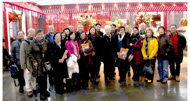
渥太華同學會聚會

渥太華培正同學會恭祝世界各地同學會同學及親友 新年蒙新恩，主恩常在，耶穌愛你，祝福你！