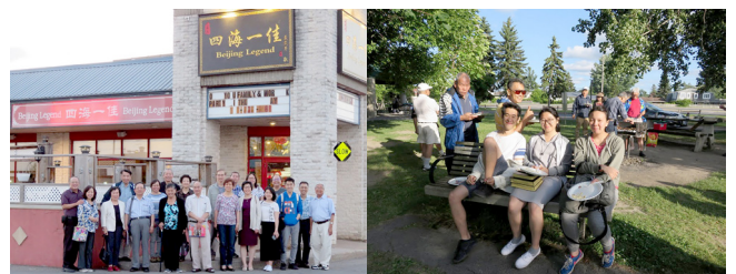
五月聚餐於四海一佳