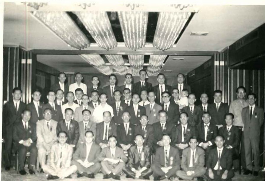
香港堅社校友畢業離校20周年邀請老師歡聚於九龍美麗華酒店

今社友雖散居世界各地，仍能先後於北京、廣州、港澳團聚，以參與金禧、鑽禧、藍星禧等慶典。二零一九年恰值本社畢業七十周年，更為可貴，惟以年邁途遠，未易勞頓，藉此對母校及崇敬之師長，致以無限感謝。