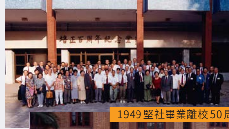
1949 堅社畢業離校 50 周年慶典