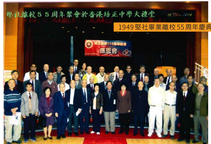
1949 堅社畢業離校 55 周年慶典