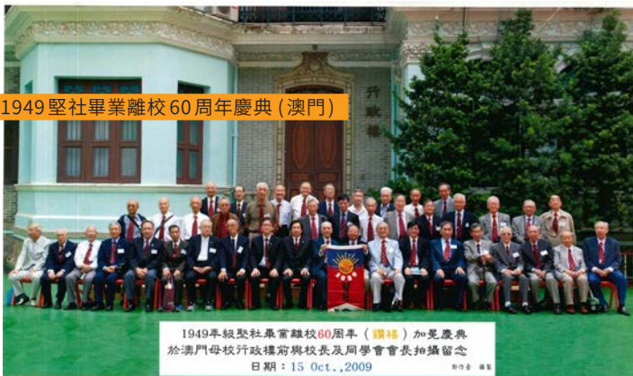
1949 堅社畢業離校 60 周年慶典 (澳門)