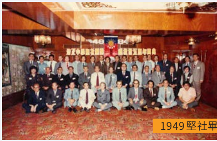
1949 堅社畢業離校 35 周年慶典