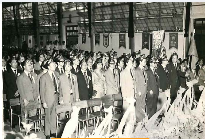
1949 堅社畢業離校25周年慶典