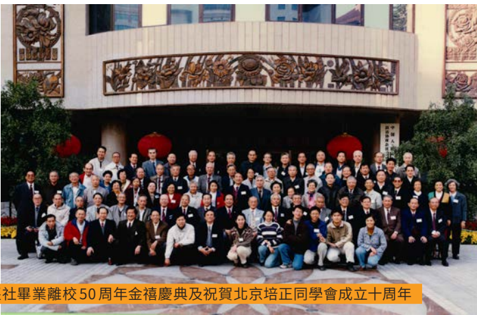
堅社畢業離校 50 周年金禧慶典及祝賀北京培正同學會成立十周年