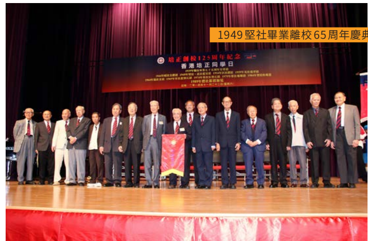
1949 堅社畢業離校 65 周年慶典