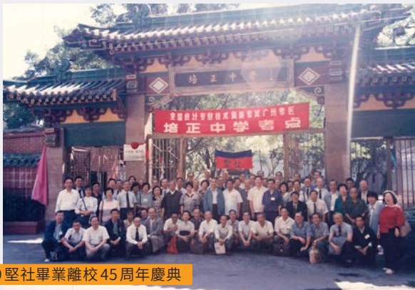
1949 堅社畢業離校 45 周年慶典