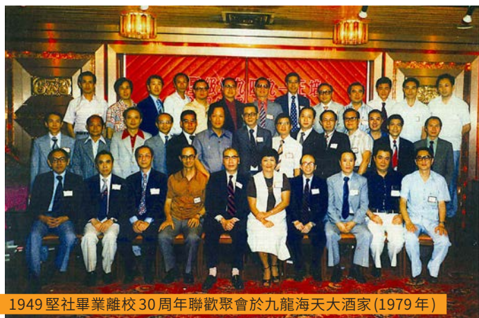
1949 堅社畢業離校30周年聯歡聚會於九龍海天大酒家(1979年)