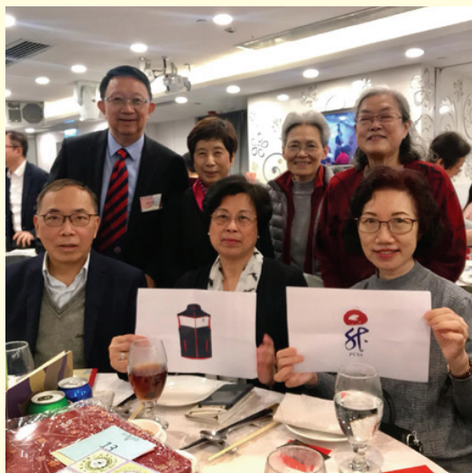
金禧工作人員昇聚