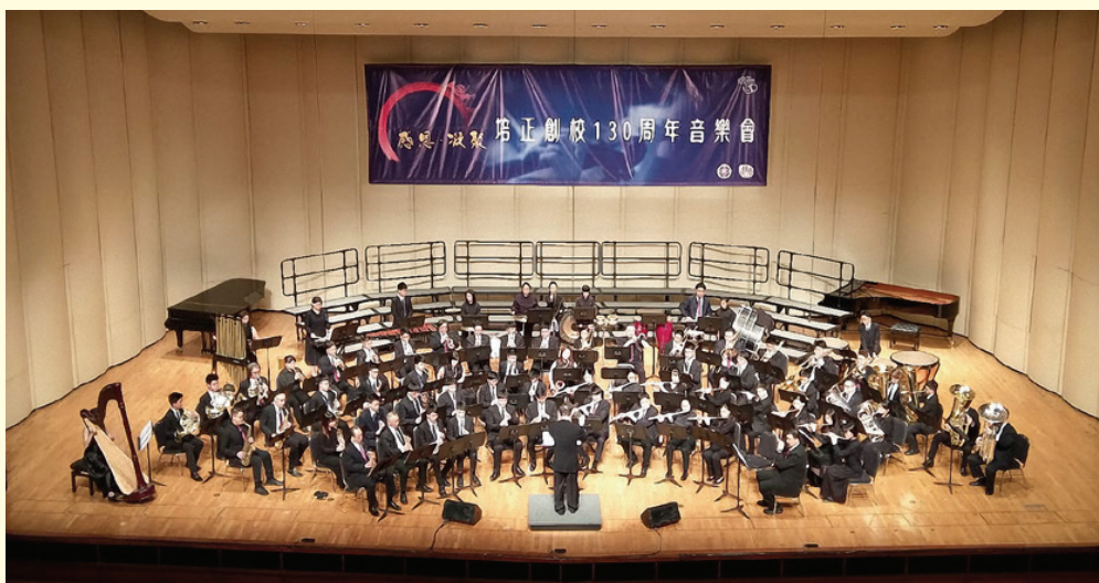
母校 130 周年校慶音樂會彩排