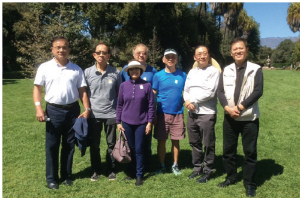
參觀 City of San Marino 的 Huntington Library