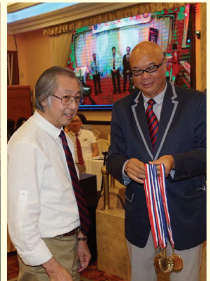
洛杉磯昇社金禧年序幕