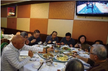
徐會長出示手機相片助證其言。