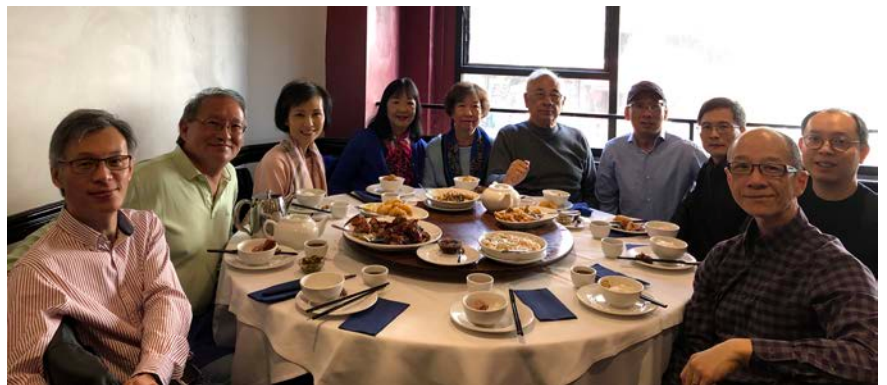
LONDON BAYSWATER 楓林小館團拜