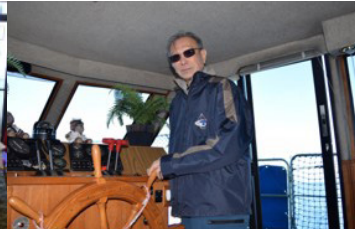
筆者在遊湖遊艇內艙