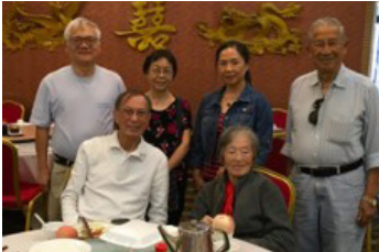
加州首府培正九月茶聚