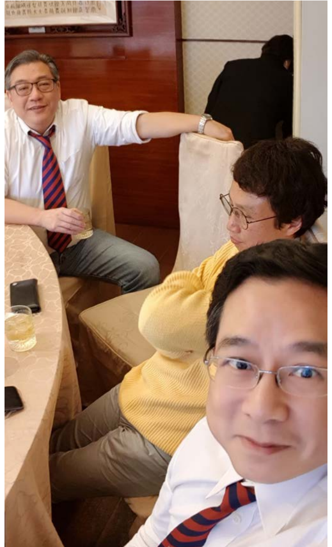
大家聊到餐廳打烊，有點醉了