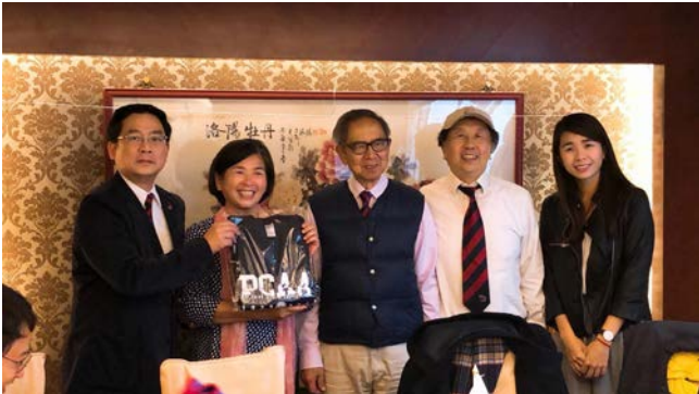
鄭家人受贈培正紀念服