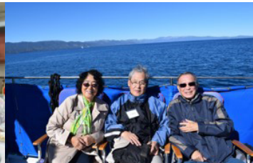
筆者在遊艇甲板上和教友馬醫生夫婦