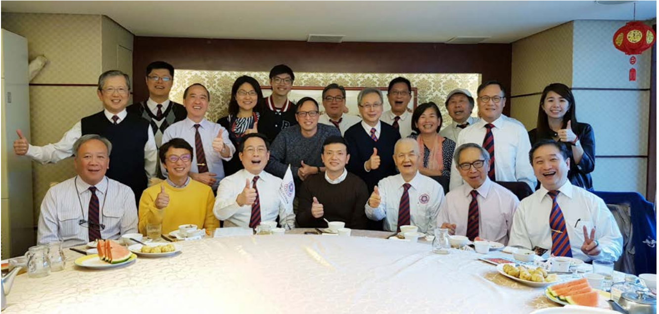
期待下次的夏季聚會!