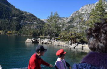
湖邊茶屋週圍美麗山水