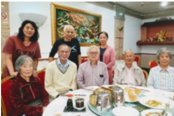
加州首府培正十月茶聚