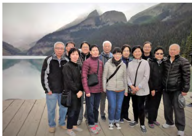
愛城校友影於路易斯湖畔