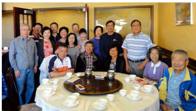
愛城和卡城校友合照1

最令人觸目的是來自中國的大熊貓。牠們活潑可愛，其起居飲食都有專人護理，生活上受照顧的程度，實在令人羨慕。晚上在住宿的酒店吃晚飯，是一頓豐富的西式自助餐。第二天早餐後便起程到世界著名的路易斯湖Lake Louise。洛機山中的天氣變幻無常，天色時明時暗，有時還下點細雨，但亦掩蓋不了湖中美景。中午到另一著名觀光小鎮班芙Banff午餐，之後到Bow Falls遊覽。至二時才啟程返回愛民頓。