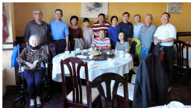
愛城和卡城校友合照2