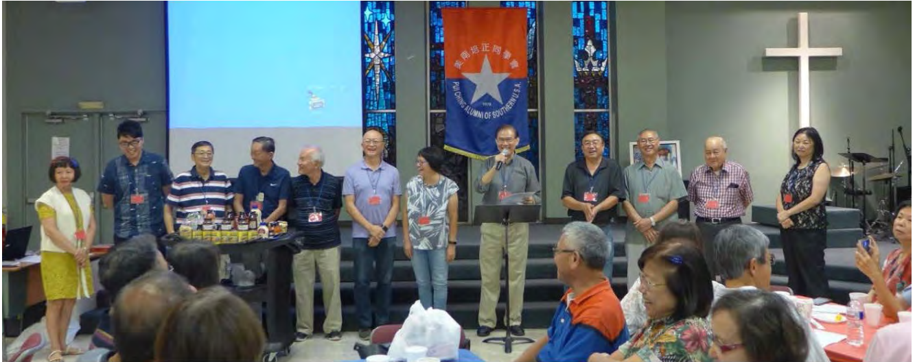
美南(德州)培正同學會職員2017年8月就職日合照