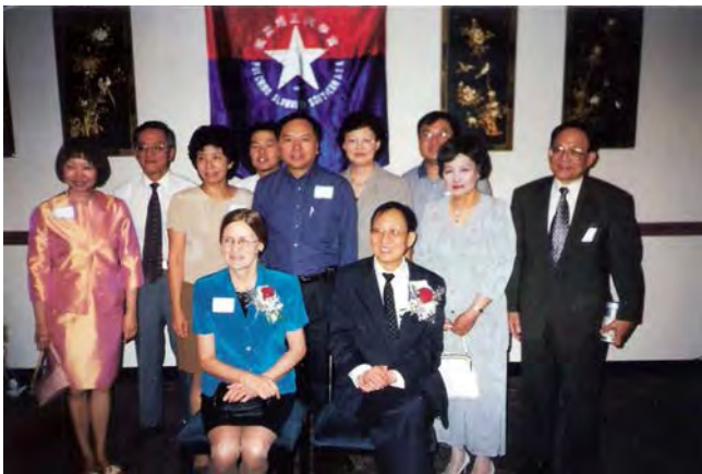
1998年諾貝爾獎得主崔琦學長(1957輝社)與夫人LINDA蒞臨侯士頓參加同學會為其舉行之慶祝餐會後與部份同學合照