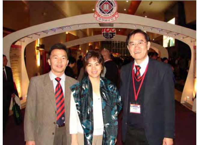
2009年11月同學日，適逢培正母校創校120週年紀念，美南（德州）培正同學會部分培正同學回港參加慶典留影