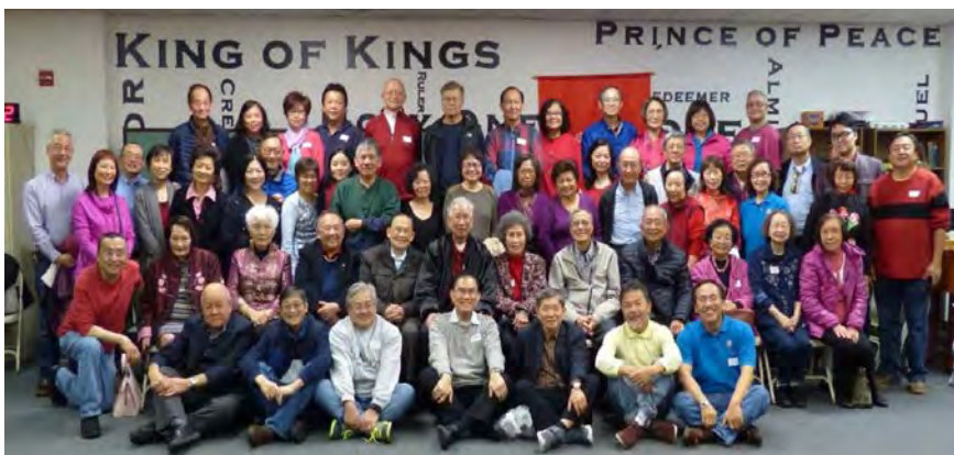
◀2017年2月4日春茗，全體參加同學及親友合照