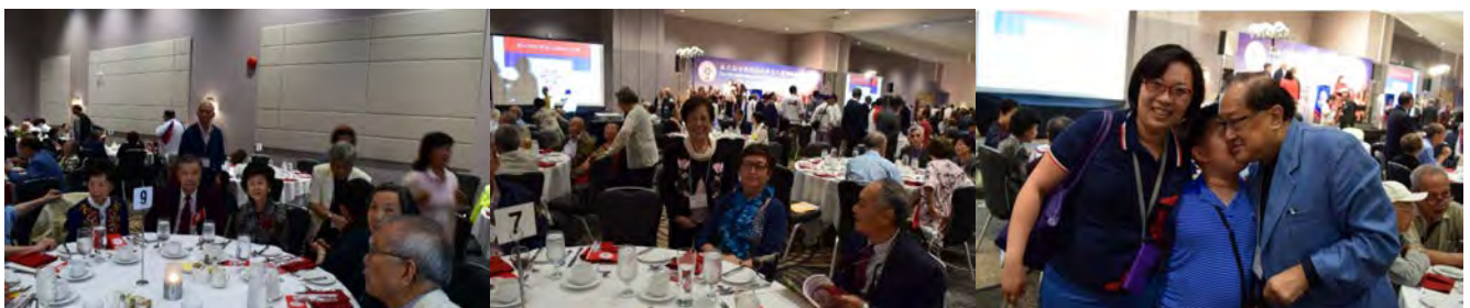
溫哥華地區匡社同學在第九枱