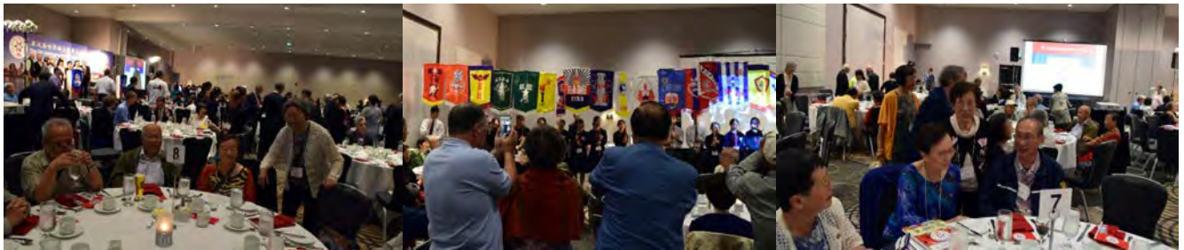
第五屆世界培正同學日溫哥華聚會盛大的西餐大晚宴