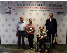
布斐餐後崔家祥夫婦及筆者夫婦