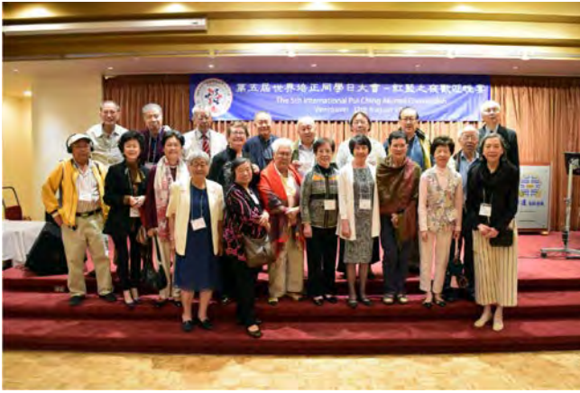
二零一八年八月十二日在溫哥華世界培正同學日紅藍之夜幸運海鮮酒家歡迎宴匡社同學合影