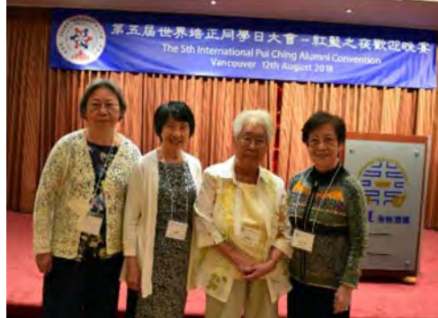
匡社梅林陳郭四姓四女生