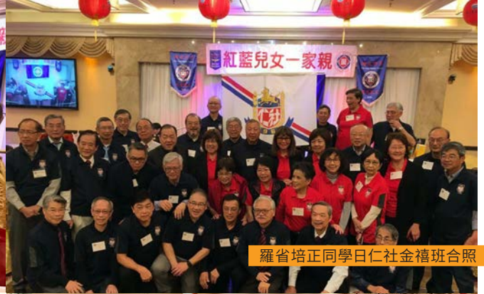
羅省培正同學日仁社金禧班合照