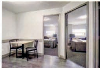
Two Separate Bedrooms In Each Suite