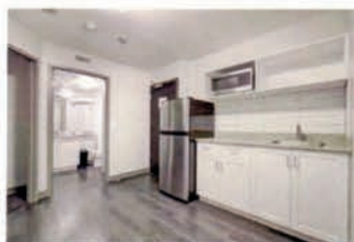
Fully Equipped Kitchenette