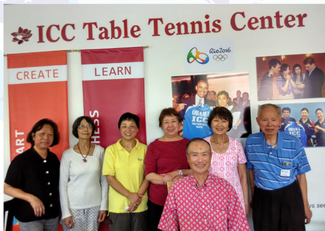
梁錦琪夫人_左四親臨球場助興