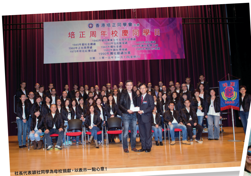
社長代表穎社同學為母校捐獻，以表示一點心意！