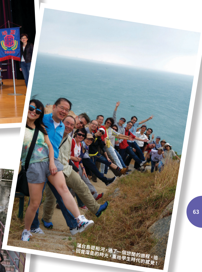
蒲台島遊船河，過了一個悠閒的旅程，追 回曾溜走的時光，重拾學生時代的感覺！