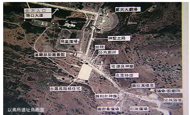
以弗所遺址鳥瞰圖

教堂穹頂搭滿鋼管腳手架，正在進行維修，想到公元五世紀建寺時，當時並無現代設施，進行高空作業，不知如何進行。中國的魯班師傅，或許採用竹子搭棚，但搭棚技術當時尚未傳入歐洲吧！