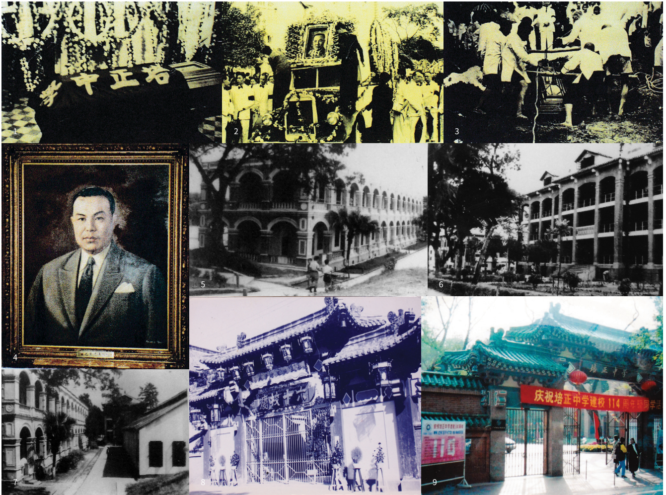
1—3 馮棠校長於一九五零年六月廿七日(庚寅年五月十三日)星期二下午四時五十四分在芳園寓所與世長辭。由教導主任林瑞銘宣告校長病逝消息發出四十五響鐘聲報喪，全校教職員工、學生聞噩默念致哀。六月廿九日正午在東山禮拜堂殯禮開始，禮拜堂坐無虛席，主禮者唐馬太牧師，由銀樂隊奏哀樂，眾唱詩「旋歸天鄉」、「與主同往」，隨即引轎柩登車，由銀樂隊奏喪禮進行曲，莊嚴肅穆，送殯者千餘人，時方天雨，陰霾滿佈，移靈行列，冒雨前行，辭靈後繼續送至沙河浸會新墳場有數百人。4 馮棠校長，5 已拆去的白課室，6 已拆去的古巴堂，7 右邊是飯堂，遠處是古巴堂，8—9 培正中學舊貌

各位校友，讓你們的後人知道這件歷史。正如羅馬政治家西塞羅(Cicero)說：「不知道你出生以前的事情，會令你一生都是個兒童。」