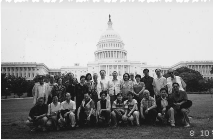
團員們合影於美國國會前