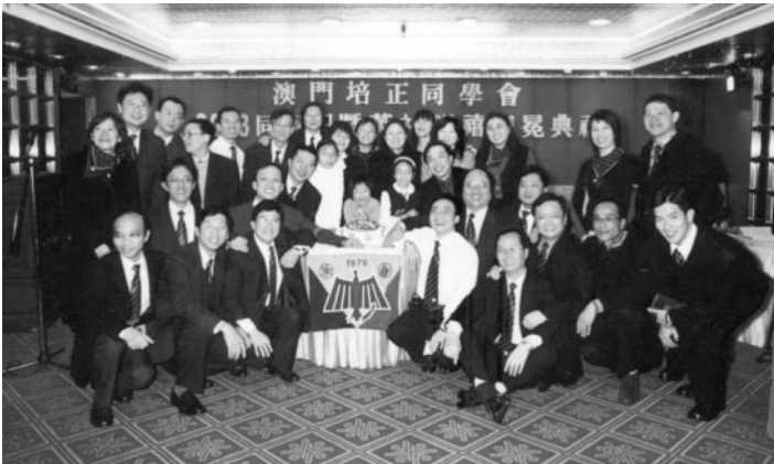
英社校友、寶眷大合照。

家」的大好日子。二零零三年十二月廿三日，是澳門培正同學會同學日暨英社銀禧加冕盛會。當日下午四時，各同學參加了於母校圖書館舉行之茶點招待會，紅藍兒女共敘暢談近況，往年逸事。歡笑聲此起彼落，瀰漫整個圖書館。