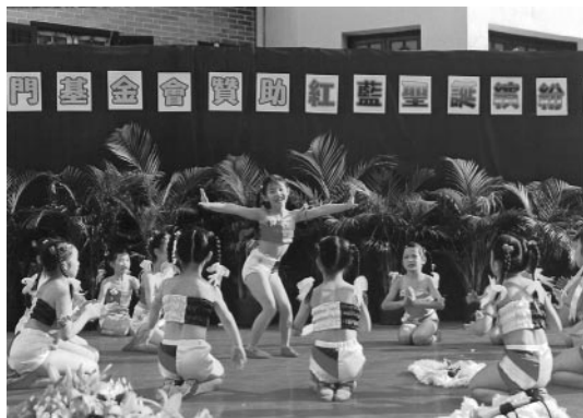
「紅藍聖誕繽紛Show」盛況。