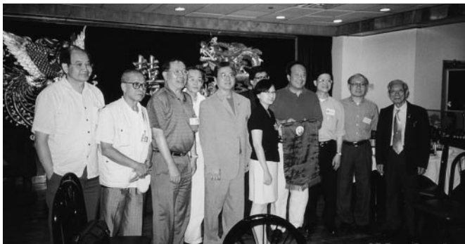
贈旗予波士頓。白甘霖會長(右五)接受