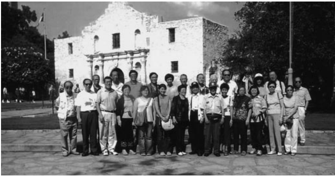
在聖安東尼參觀抗敵古堡