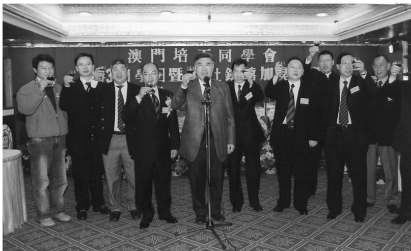
同學會首腦祝酒致意。

智慧與及協調技巧，且獎品豐富，加上是由學兄學姐親手設計，故此小學同學玩得亦樂乎，歡笑聲此起彼落，到處都響徹了快樂的聲音。