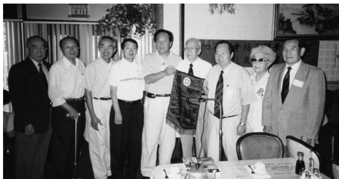
二埠羅根合會長(右三)接受香港同學會贈旗