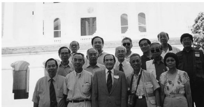
與二埠校友們合影於加省省議會前