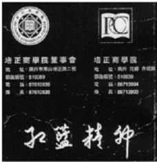
1997年以前培正商學院的校徽

「寶華培正」採用的校徽是什麼樣子呢？ 由培正商學院同意「寶華培正」採用的校徽是什麼樣子呢？