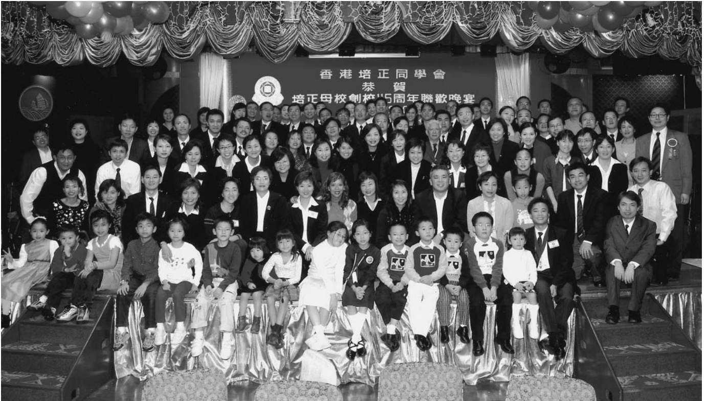
榮社全體校友及眷屬在慶祝創校115周年大晚宴上合影於禮台上

比賽結束後，大家把握時間趕緊午膳，因為一個重要時刻正在等著我們呢！是甚麼？大家還記得當年在大樓梯的合照嗎？讓我們來重拾當年，在大樓梯再來一次大合照吧。我們安排了專業的攝影隊伍，首先為各班來一張小合照，然後再來一張真正的大合照。數一數，出席這個合照的共有七十多位同學，你能認出他們嗎？難得的是，部份同學真是趕著回來拍照的，一些是剛下班的，一些更是在早上剛下飛機，從海外趕回來的。整個合照過程擾攘了一個多小時。為了令這次活動更有記念價值，籌委會為每