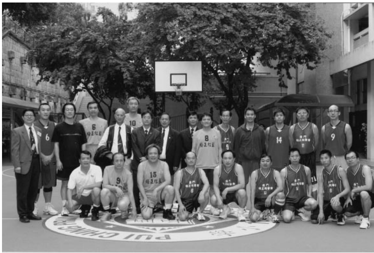
港澳校友埠際賽前合影於吳華英紀念球場

邀請知名學長，負責不同行業作專題講座，讓各學長獲益良多，會後飯聚，藉此聯絡情誼；曾組織學長，前赴廣州、台山、中山、江門、珠海、澳門及上海市，參與學校活動或與當地同學會學長聯絡，以增「紅藍」情誼；本人再次呼籲各學長，參與同學會各項舉辦之活動，贊助同學會通訊費，在此謹祝學長們健康、聖誕快樂及家庭幸福。