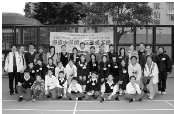
大夥兒出發探訪獨居長者