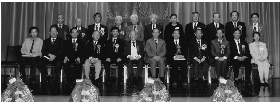
各地同學會會長及代表與各校長及香港同學會各會長理事合影