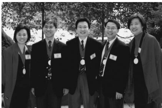
榮社同學攝於加冕日

了。榮社加冕活動的首個項目是甚麼？就是在 12 月 1 日……加冕典禮前一個晚上進行的『綵排』活動！