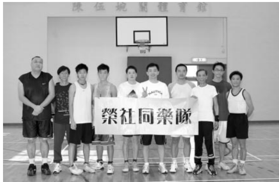
榮社老中青三代籃球健兒

加冕活動的最後一個環節是『謝師宴』。同學們有今天的成就，全賴校長及老師們當年的悉心教誨培育，在50年後能再有機會向他們答謝，實在是難得及榮幸。12月20日晚上，我