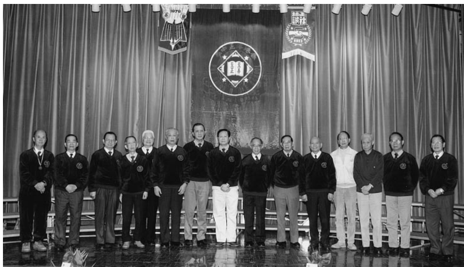
出席同學日大公宴

座談會中，有同學倡議，在五年後鑽禧活動時，要盡可能攜同老伴及兒孫來參加，屆時當另有一番盛況。更有同學希望，爭取五年後有機會在台北由建社台灣同學會主辦鑽禧活動，這將更有意義。歷時二