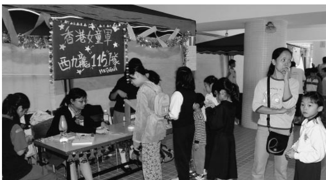
培正女童軍西九龍115隊之攤位