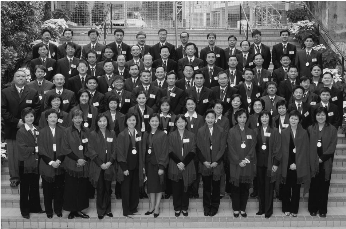
榮社(1979)各社友在大樓梯石級大合照