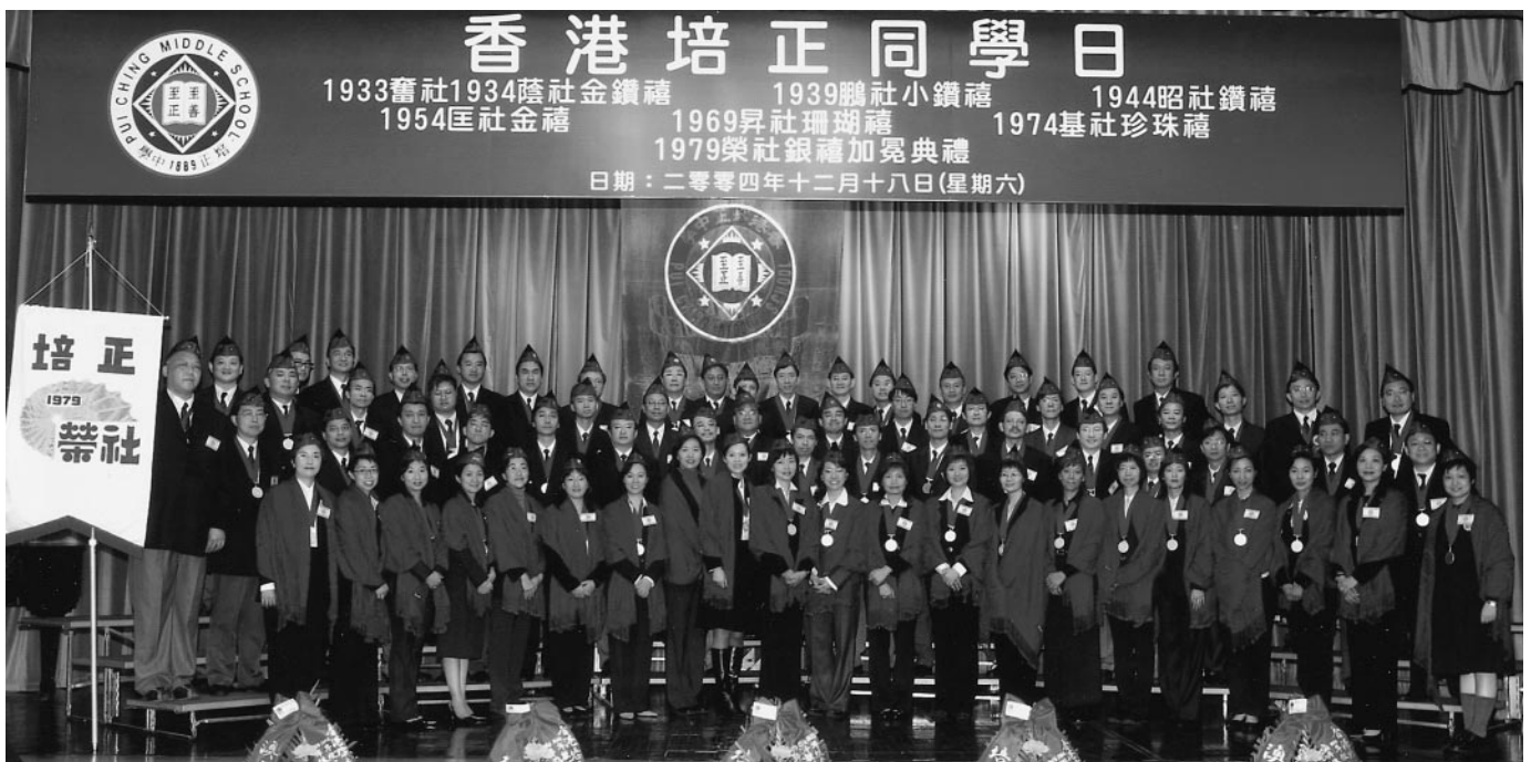
榮社加冕台上合照

二〇〇四年十二月十八日(星期六)為母校創校一百壹拾伍周年，香港培正同學會定於是日舉行同學日，一九七九年級榮社加冕班，舉行籃球友誼賽，假中學陳伍婉蘭體育館舉行，揭開同學日活動序幕，與此同時中、小學校舍開放，各攤位遊戲亦同時進行，學生家長偕同就讀學子前來參與，遊藝攤位異常擠擁，好不熱鬧。一時三十分過後，校友們陸續返校，簽到後分別前往校園參觀，年長學長相遇，握手言歡，緩步到小學飯堂參與茶聚，樂也融融。