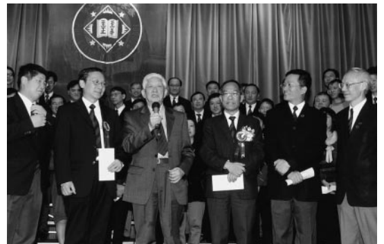
左起：葉賜添校長、林英豪校長、李仕浣校長與基社同學