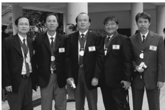
榮社同學攝於加冕日