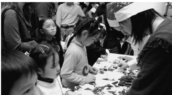
小學攤位遊戲圖片之一