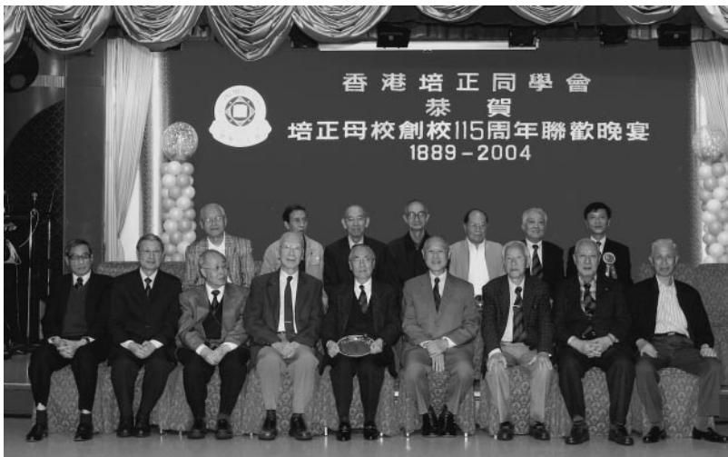
1949聖社烹社慶賀小鑽禧合影於台上