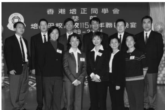
榮社銀禧加冕日大公宴上

一班榮社的校友及家屬，一班培正的小學生，還有一班電台的聽眾，早上在培正禮堂集合成一支達30多人的隊伍後，一同出發前往探訪多戶獨居的長者。在探訪過程中，除了帶給長者一點關懷意外，亦可讓小朋友認識到獨居長者的境況，讓他們想一想，日後該怎麼辦對待他們家中的父母或長輩。