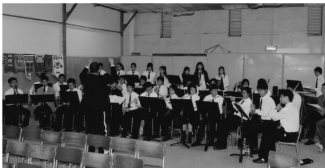
香港培正銀樂隊在大禮堂演奏時攝