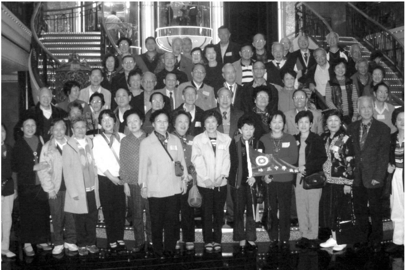
誠社慶祝畢業50週年在香港共乘獅子星輪遊下龍灣