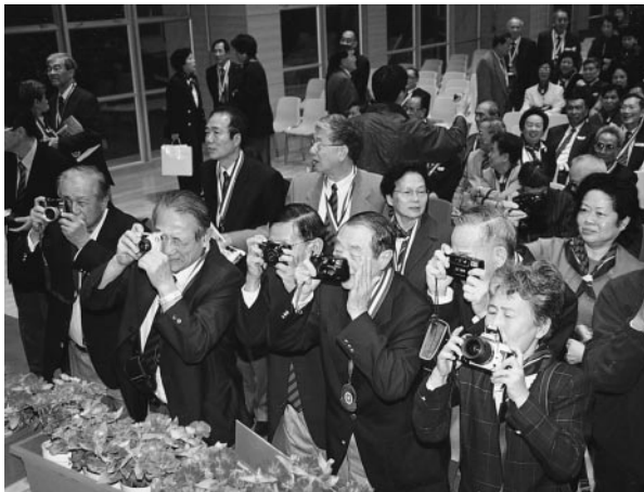
誠社眾校友台下舉相機擺靚景