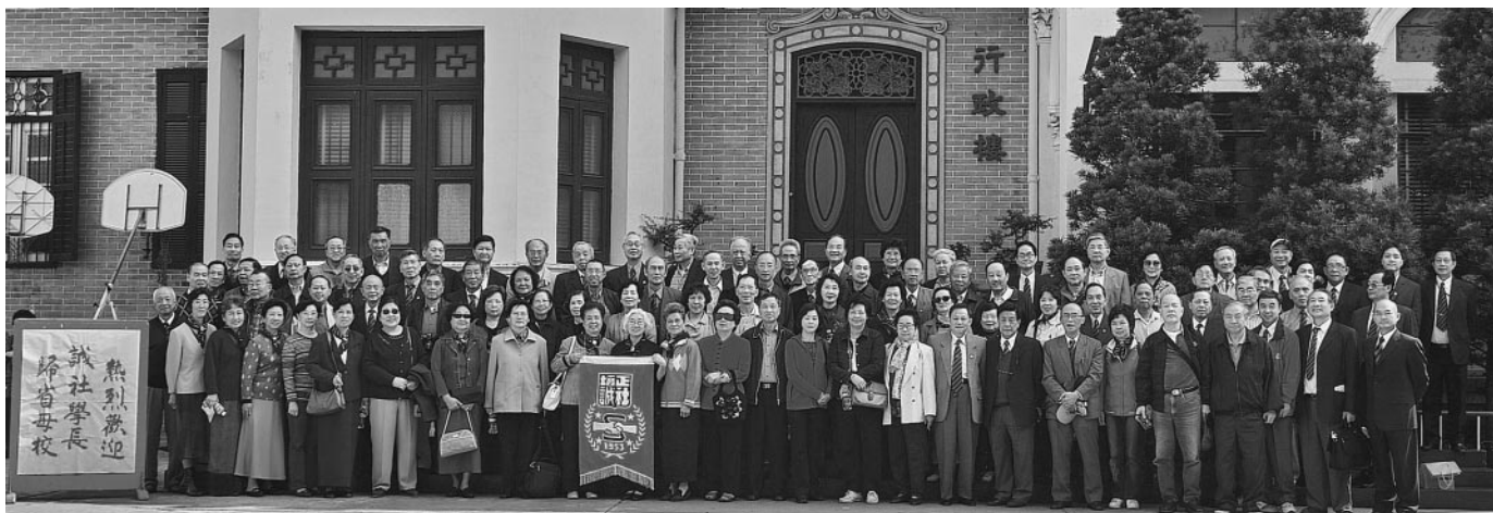
(1953)誠社金禧紀念重臨母校參觀懷舊留念 澳門培正中學敬贈 2003.11.28