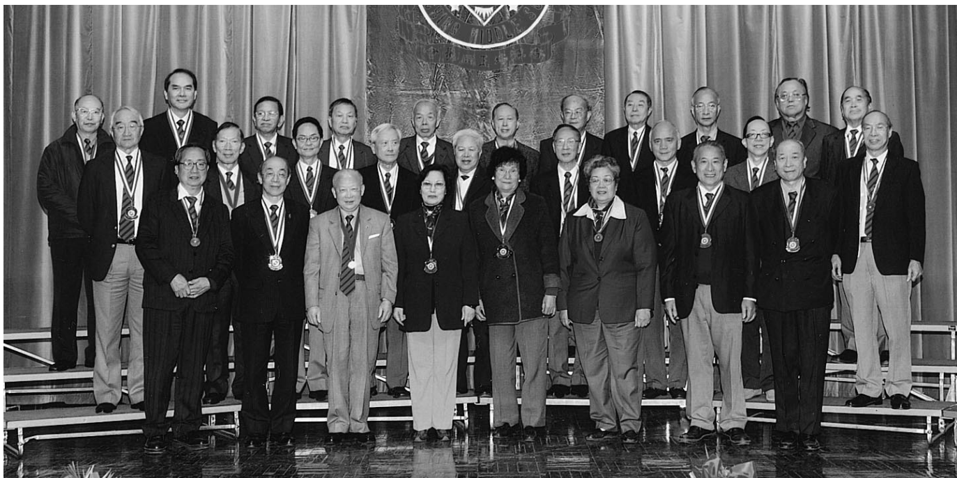
留港誠社同人參加香港培正同學日攝於台上

註：簡史錄自廣州誠社同學1988年出版的《培正誠社畢業35週年紀念冊》，此史簡潔明確，特轉載之。