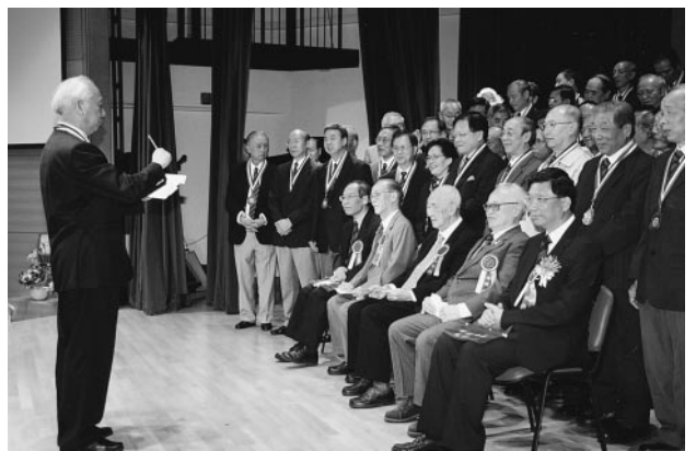
誠社校友合唱金禧紀念歌

體合照，送給全體同學，人手一份；澳門培正同學會又贈送連套原筆每人一份，作為訪問澳門母校的珍貴留念。賓主暢談培正及盧家花園往事，把盞言歡，甚是投機。 《澳門日報》亦於十一月廿九日，將我社訪問澳門培正母校的消息，在社團版上通欄標題：