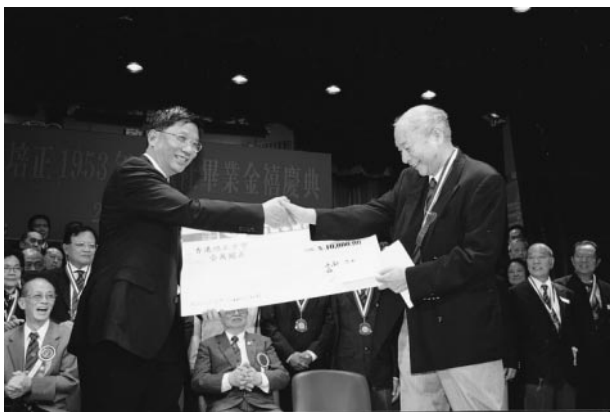
誠社捐贈支票與香港培正中學

中學及同學會獻旗。禮成後，全體誠社同學參觀了學校新建設，特別是新禮堂大樓的體育設施，設備先進，為同學們創造更好的培訓環境。七時，在培正前座膳堂舉行大晚宴，筵開十二席。久違學生時代的大剷雞、牛白腩等菜式，令大家回味無窮。