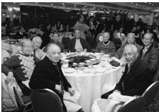
鋒社學長攝於同學日大會席上

鋒社社歌 是蔡雨村先生 作詞，何樂芝先生作 曲，全文如下： 手腦從今要活動，向前 猛進向前衝！祖國已臨危 亡地，我輩安能奴戮終。 強體魄兮揚文化，求光榮 兮於遠東，紅藍旗下無弱 卒，鋒社健兒氣如虹。 全曲氣勢澎湃，壯志高 昂，充份表現了大時代青 年的勇邁。