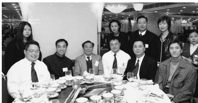
何樂昌老師與英社社友