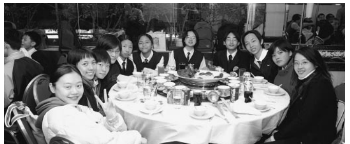
香港培正中學學生會女生