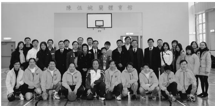
英社籃球隊、社友家屬與母校校長及同學會會長們合影