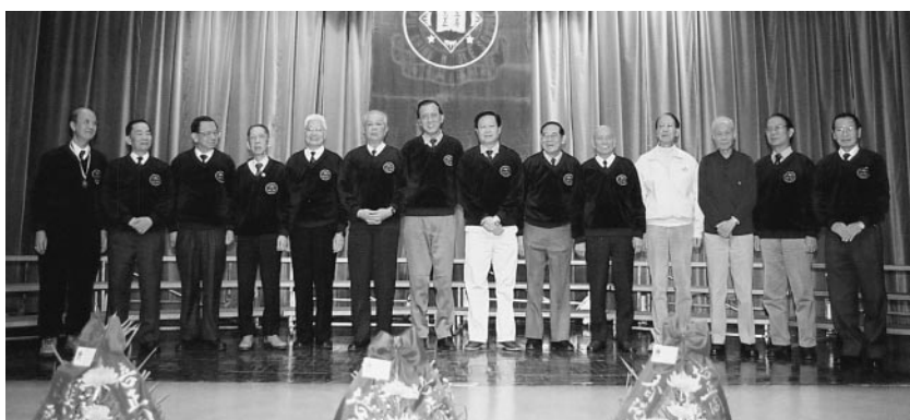
建社(48)留港學長慶祝小鑽禧合影於禮台上

資助多個活動攤位，以供在學後輩參與，計有野外定向、創意思維、星空奇遇、公益少年、紅十字會、男童軍及Institutions等攤位。中學新建禮堂綜合大樓四樓，舉行校友籃球友誼賽，母校教師隊與珊瑚禧仁社隊對壘，澳門校友隊與香港校友隊比賽，以娛校友。大禮堂前曠地，中學銀樂隊於四時開始，不停步操演奏，為同學日大會序幕前生色不少；母校假膳堂供茶點與校友享用，使年長學長在膳堂內，