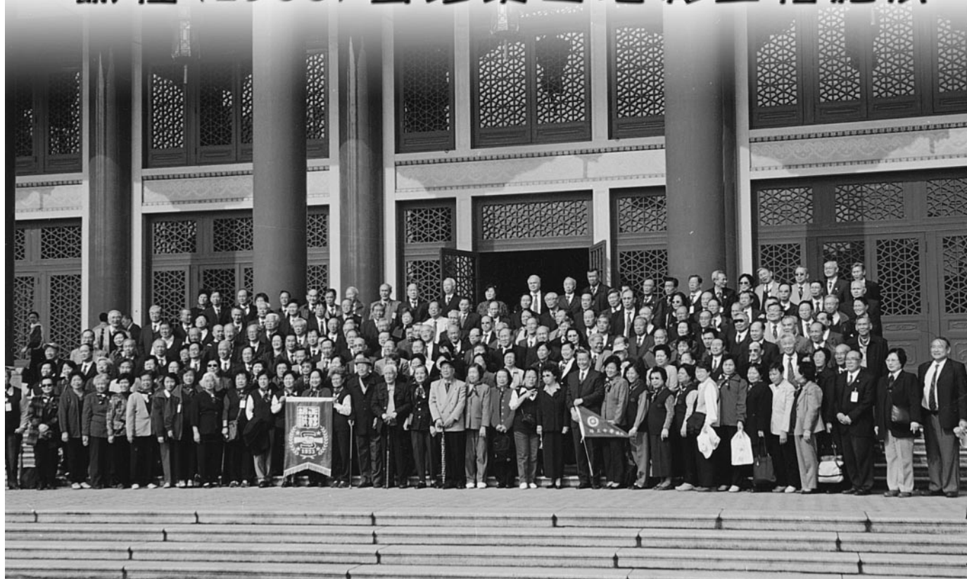
全球誠社校友雲集省、港、澳，集中在廣州中山紀念堂前，校友逾140人，連社嫂社婿達220多人