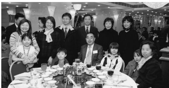
羅桂森老師與英社社友