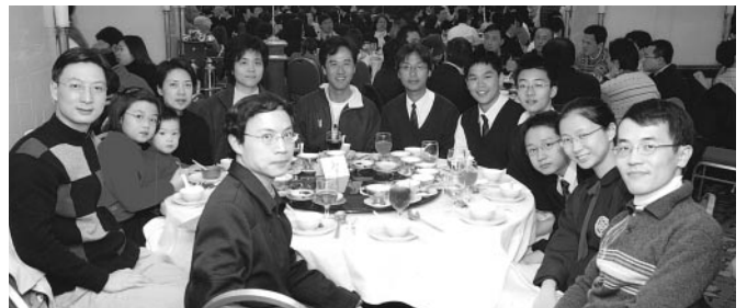
智社(1984) · 凱社(1983)