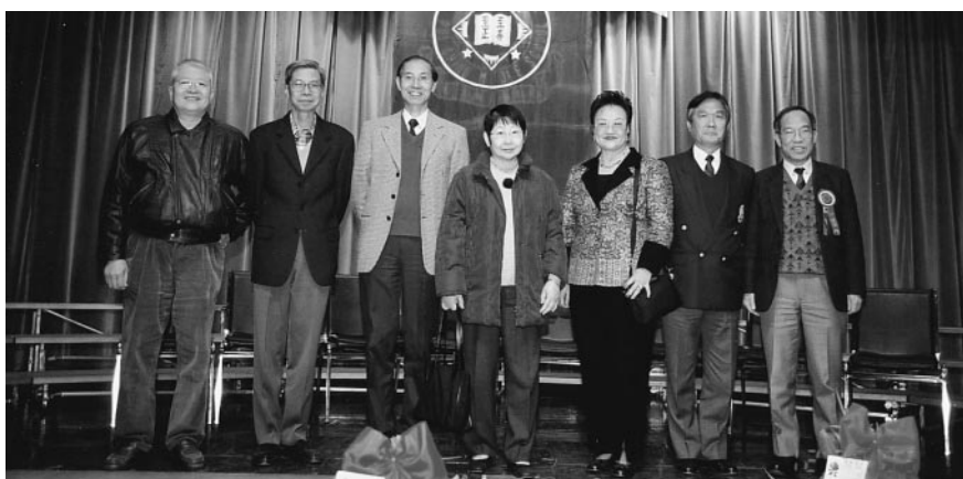
真社 (1963) 學長慶祝離校40周年攝於禮堂上

中學新禮堂已於去月二十七日，恭請教育統籌局局長，於該天蒞臨綜合性大樓，舉行揭幕啟用典禮，該幢綜合性大樓，由策劃至建成，歷時十二年之久，幸賴前校長鄭成業先生與各有關部門緊密聯繫，工程才順利完竣。