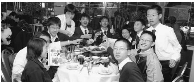
香港培正中學學生會男生