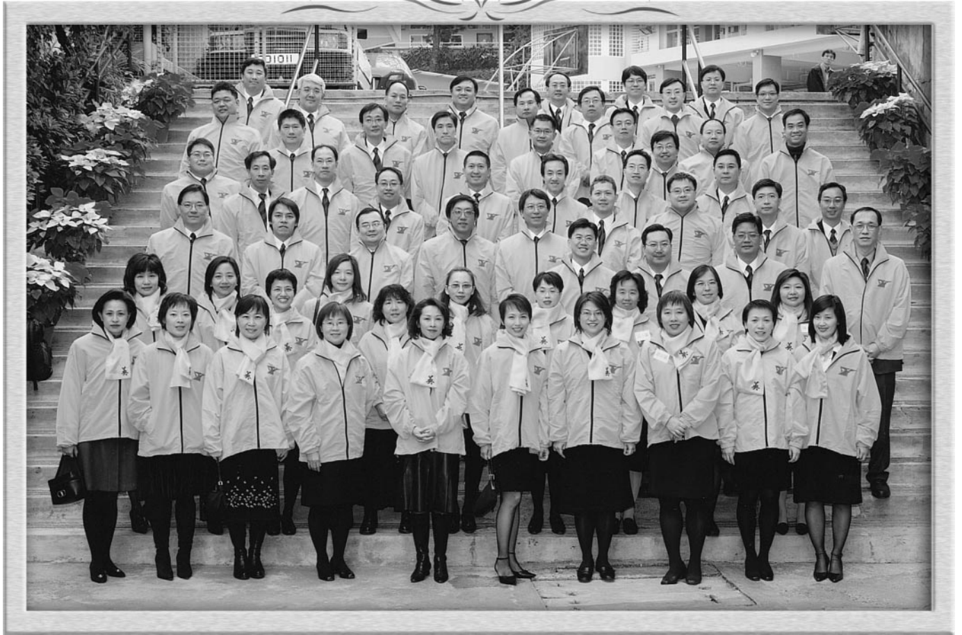
英社男女社友於銀禧加冕日合攝於大石級