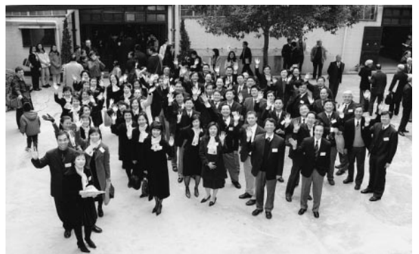
英社同學們相約十年後珊瑚禧再重聚母校