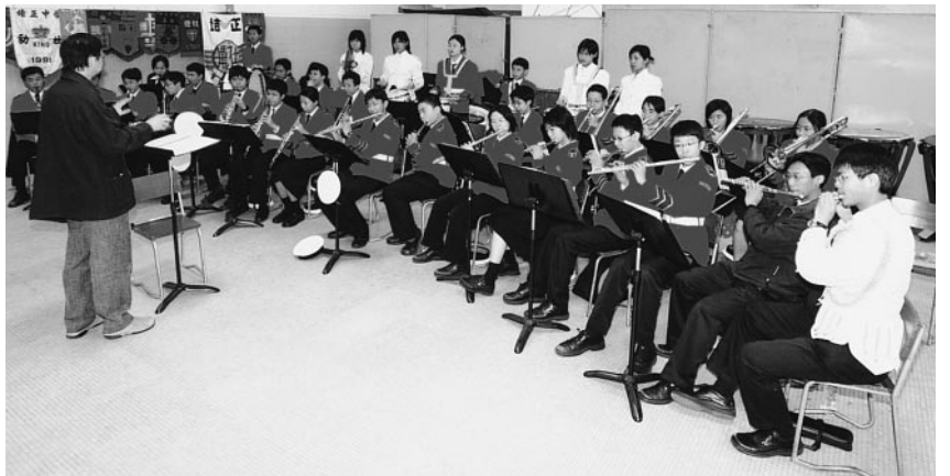
銀樂隊每年均為同學日演奏助慶