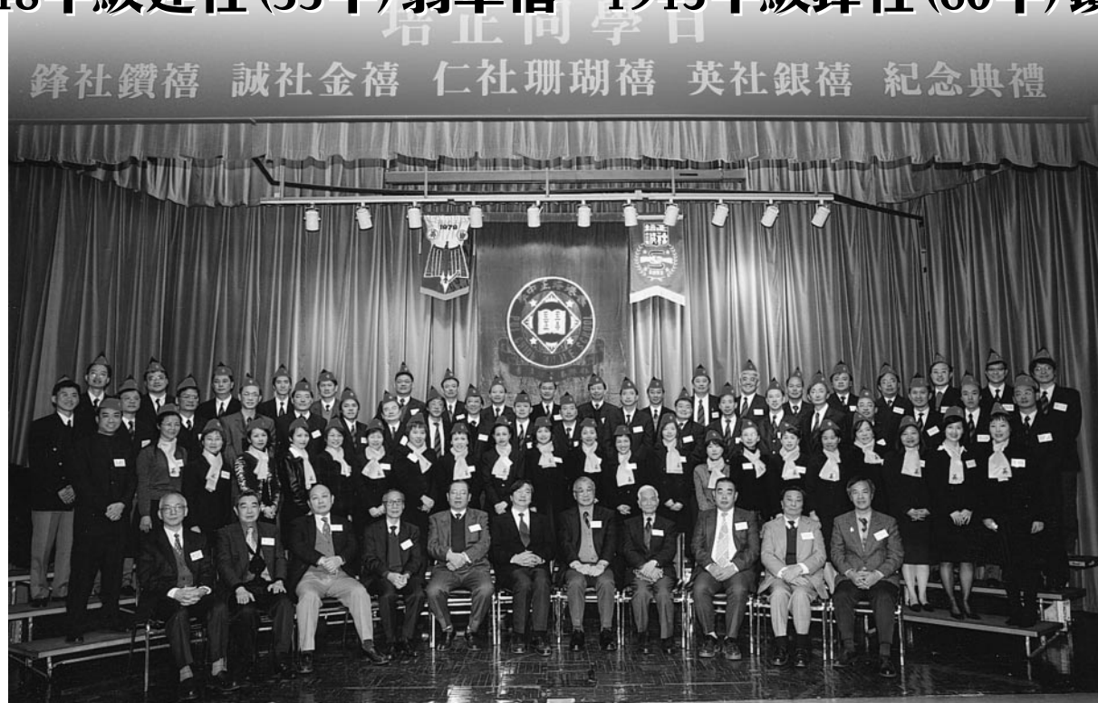
英社1878年級同學離校25周年銀禧紀念合影於禮堂台上

二〇〇三年十二月二十日(星期六)，香港培正同學會舉行本年度同學日，假座母校中、小學校舍內舉行各項活動，沿窩打老道及培正道校舍圍牆四周，紅藍旗幟隨風飄揚，童軍隊伍分立於中、小學校門兩旁迎接校友歸寧，同學會會長、副會長及常務理事；母校中、小學校長、副校長忙於迎接校友與寒暄。中、小學校舍全面開放，並由負責教師駐場傳釋；英社銀禧加冕級社，