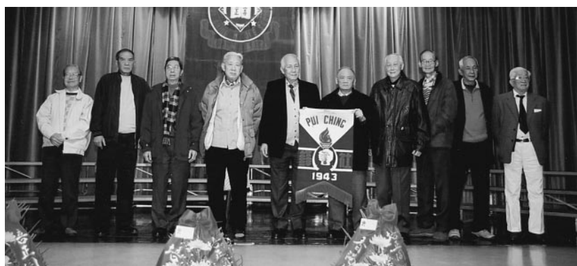
鋒社(43)留港學長鑽禧紀念合影於禮台

二〇〇三年十二月二十日(星期六)，香港培正同學會舉行本年度同學日，假座母校中、小學校舍內舉行各項活動，沿窩打老道及培正道校舍圍牆四周，紅藍旗幟隨風飄揚，童軍隊伍分立於中、小學校門兩旁迎接校友歸寧，同學會會長、副會長及常務理事；母校中、小學校長、副校長忙於迎接校友與寒暄。中、小學校舍全面開放，並由負責教師駐場傳釋；英社銀禧加冕級社，