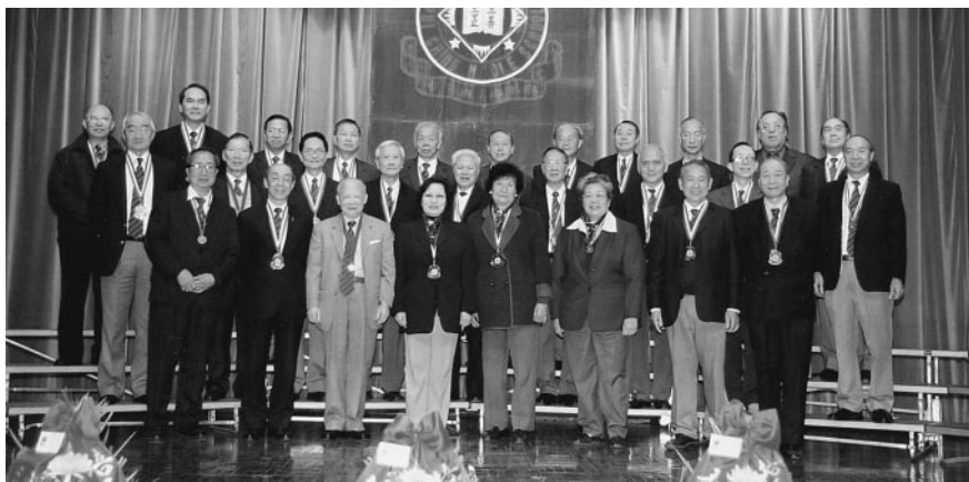
誠社 (1953) 留港學長賀金禧攝於禮堂上