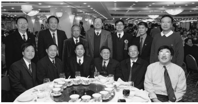
穗澳代表與仁社同學