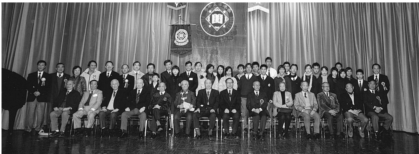
紅藍精神代代相傳之30年代至21世紀各級代表攝於台上

台及下台，寶刀未老也。鋒社鑽禧盛典參與之學長，步履穩健登台，全場掌聲雷動不停了，為學長有健康身體而高興。同學日大會各項程序，至下午七時十分方順利完成，與會學長步出禮堂，前往窩打老道豪華酒樓參與晚膳，是夕筵開四十六席，美酒佳餚，大快朵頤，歡樂氣氛洋溢，至十時許始歡聚完畢。林學廉