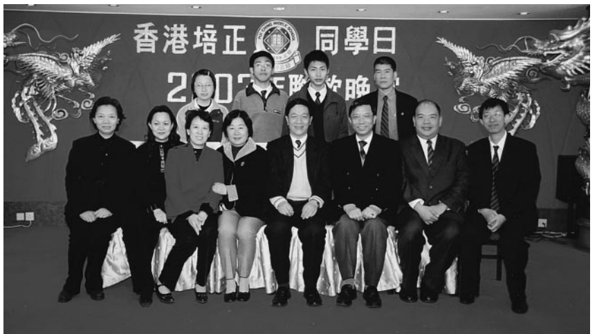
廣州師生代表合影於香港培正同學日