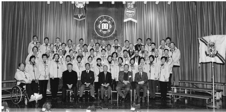
仁社 (1968) 學長們慶祝珊瑚禧合影於台上