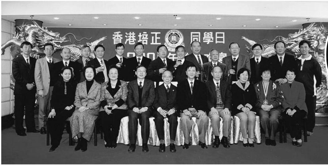
香港澳門廣州三地會長、校長及海外各地各禧班代表大合照