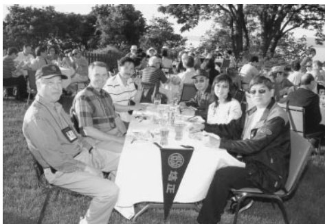
市長與籌委坐首席