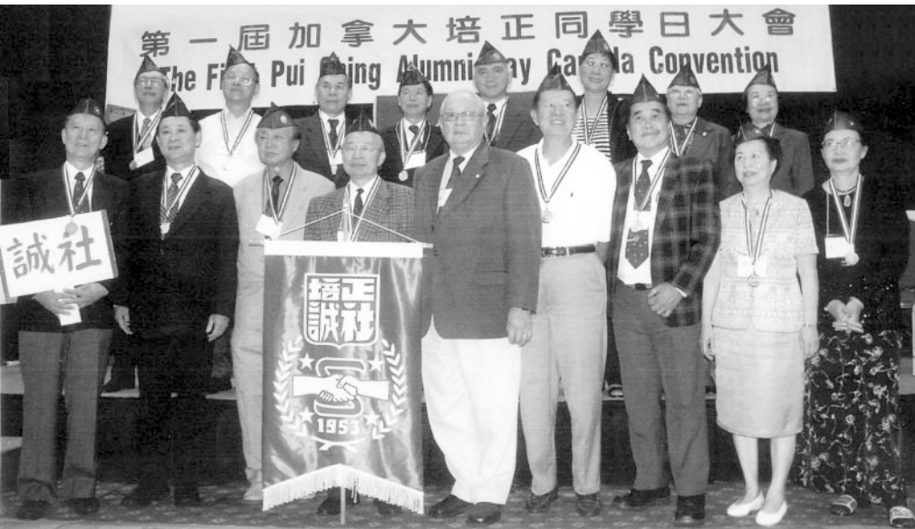
誠社溫哥華慶金禧

第一屆加拿大培正同學日大會 The First Pui-ting Alumni Day Canada Convention