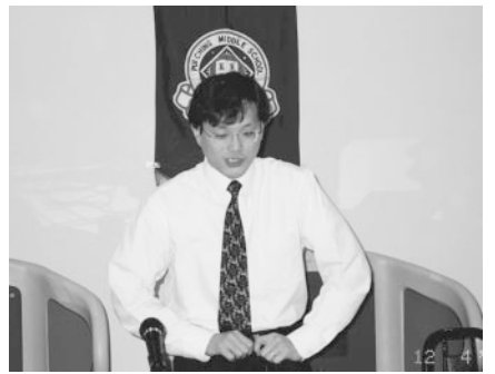
香港經濟展望。黃耀(77傑社)