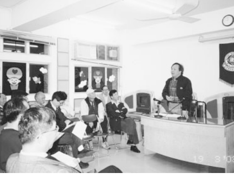
雷禮和(68仁社)略談環保在中國的商機