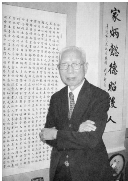
田家炳對朱柏盧《治家格言》推崇備至，辦公室內掛滿由不同單位送贈的朱柏盧《治家格言》