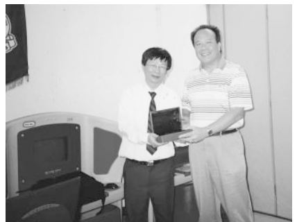
黃今是 (61善社)：網上學習

欲得E-learning的有關資料，可瀏覽浸會大學下列網頁： cshuang@comp.hkbu.edu.hk