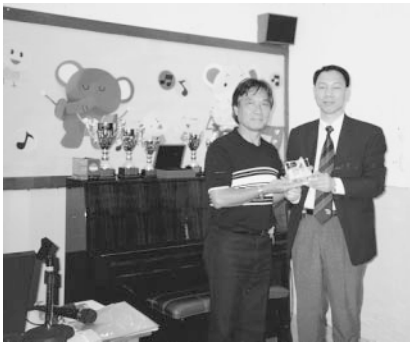
焜全 (76敏社)：醫療工作者對「抗炎」行動的感受