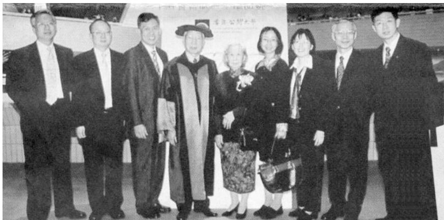
田家炳對教育的熱忱得到社會肯定，圖為他於2001年獲香港公開大學頒發榮譽博士時與夫人及子女合照。左起：定先(五子)、文先(二子)、慶先(長子)、田家炳及夫人、淑玲(四女)、淑蓮(三女)、榮先(四子)、熾先(三子)。

他一生未作官，潛心鑽研程朱理學。著有《四書講義》、《愧納集》等，當中以《治家格言》最膾炙人口，成為近代家庭教育的必讀課本，其中雖然包括宣揚封建道德觀念的詞句，但很多生活道理發人深思，至今仍有教育意義。