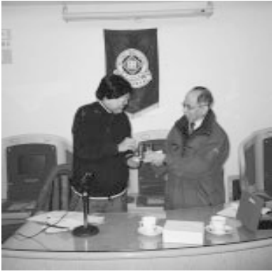
王煜(56瑩社)、全真教群英的真面目

此篇又謂「聖人法天貴真，不拘於俗。」難怪主張三教合一的全真教始祖王希(112-1170)行為反世俗。生於陝西終南縣，他隨金軍收復陝西而獲低職「酒監」，辭職後不理妻