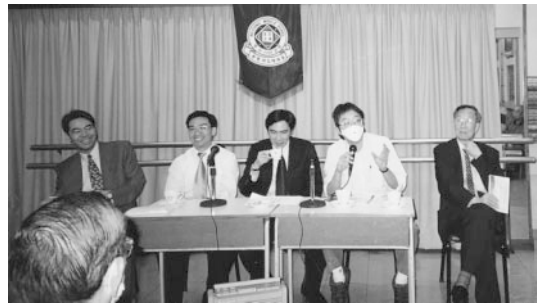
非典型肺炎治療座談會