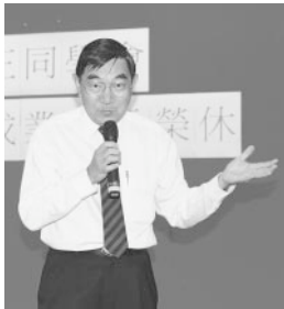
前泰國會長蔡業強