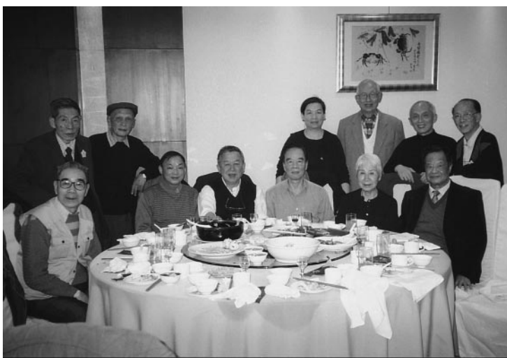
台灣校友與部份上海及各地校友合照