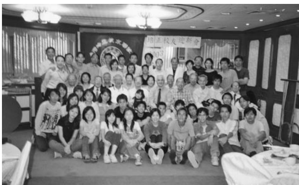
2003年11月8日，台灣培正校友歡宴港澳培正僑生全體合影