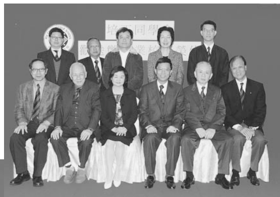
鄭校長及副校長與副會長理事們合影