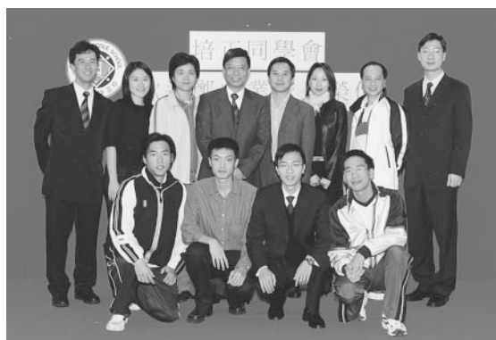
鄭校長與培正體育會同人合影

他的名片，上面寫了超過十個職銜，包括大學和中學校董、幼兒院董事以及香港紅十字會董事等等。 【節錄培正校刊文章】