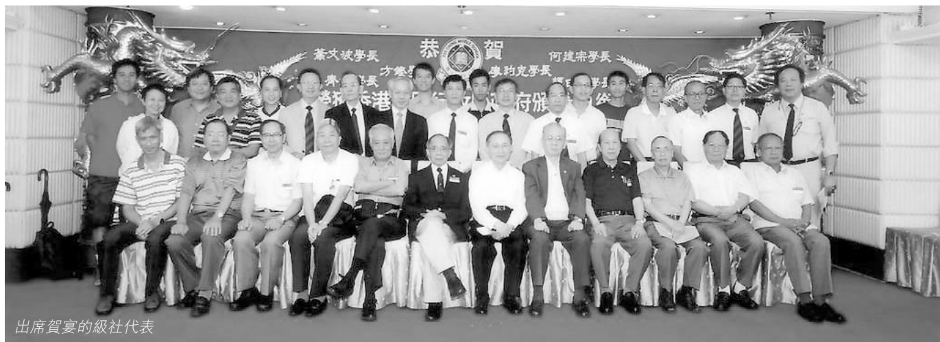
出席賀宴的級社代表