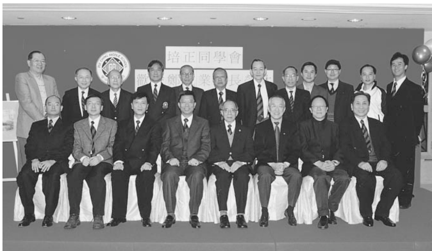
各地同學會會長顧問理事們與鄭校長合影