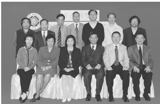
昇社同人與鄭校長合影