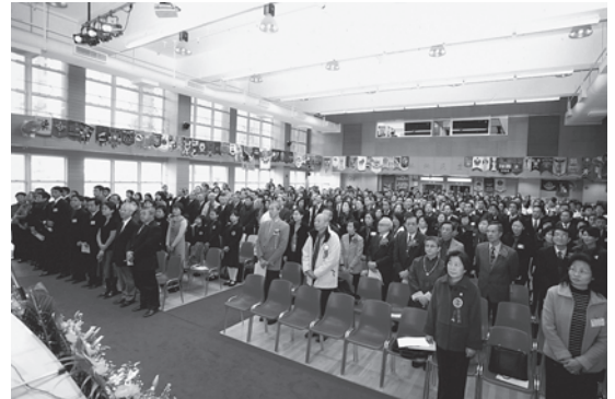
同學日大會首次在中學禮堂舉行