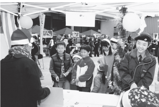
培正中學跳蚤市場