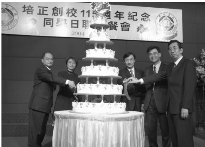
簡單而隆重的切蛋糕儀式

澳門培正中學宗教研問梅保羅牧師等。感恩會暨剪綵禮的觀禮嘉賓還包括澳門培正同學會首腦、各地培正訪問團、各地和本澳友校代表和社會賢達等。