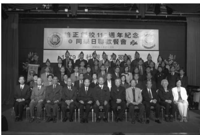
聯歡聚餐上主禮嘉賓與同學會執委成員合照

光陰似箭，擔任澳門培正同學會會長轉眼已有一年多的時間，承蒙校友和各界友好的鼎力支持，各項會務工作得以順利開展，謹代表同學會全體工作人員向大家致以衷心的感謝。