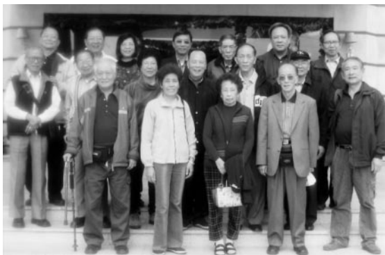
與中山同學會校友歡聚(中排右一至三)

先進大學之一。市區建設豪華，街道寬闊有序，市容整齊清潔，顯然規劃上用了心。其後往參觀院士路，路旁有十二位中國科學院士雕像，都是五邑籍。其中一位是本校斌師陳灝珠醫生，老瑞麟老師同學，心肺科專家，更受團員歡迎。有人為塑像配上校吹，頻頻取景合照，份外光榮。稍後往購物區遊逛，鄭校長連購三處陳皮，儼然有為私房菜作料做好準備。晚飯在港式酒樓用膳，共開二席，經濟抵食，菜式在港難以嚐到。飯後主客分手，互說珍重。本團則乘車直取中山國際(五星)酒店，連日太累，夜市也懶得