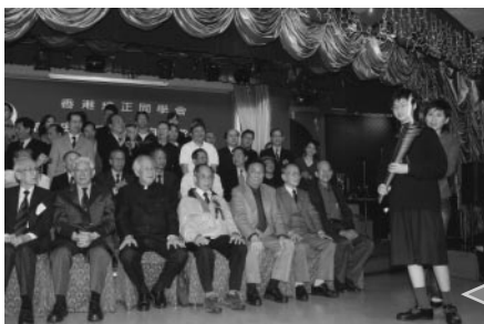
信社(2004)代表承接紅藍薪火