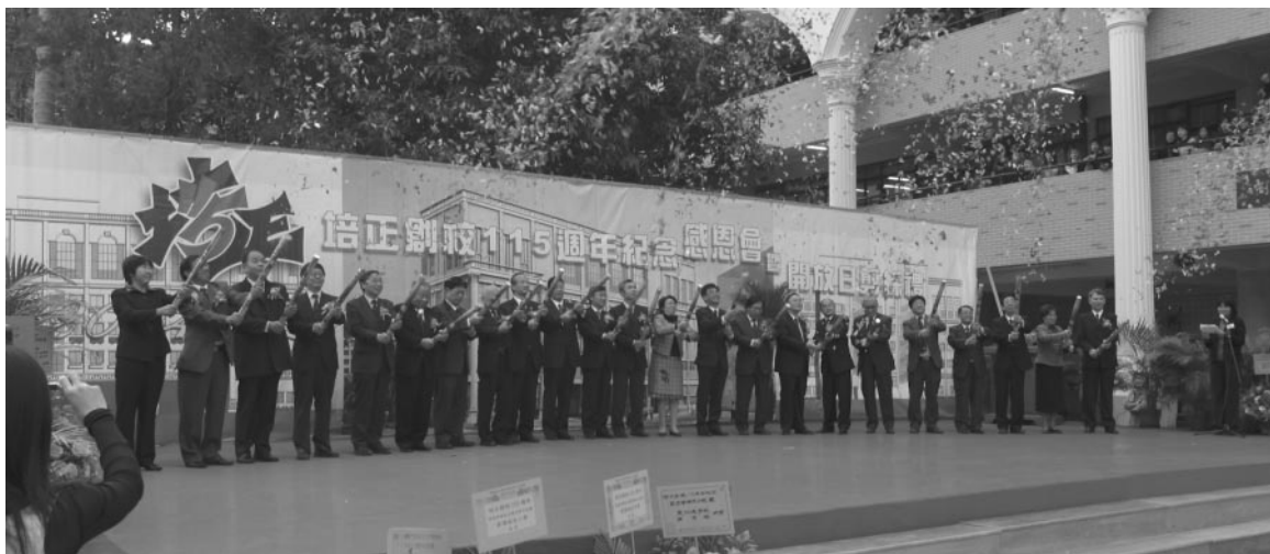
澳門培正中學紀念建校115周年開放日校園剪綵禮

澳門培正中學於二零四年十二月廿三日至廿四日一連二天舉行「創校一百一十五週年紀念」感恩會暨開放日及同學日慶祝活動。