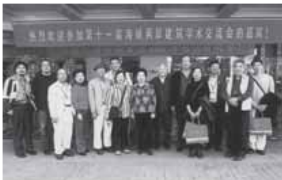
2006年11月安徽合肥 參加海峽兩岸第十一屆建築學人交流會