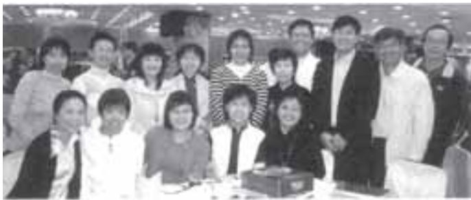
2月25日香港培正新春聯歡晚會

隔別35載的母校已經在多番改變下，面目全新。幸而我中一愛的課室並無太大的改變。當我坐在我舊座位時，實在感慨萬千。