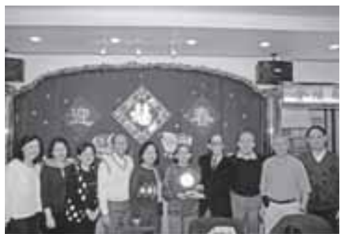
各地誠社負責人宴會開始時祝酒