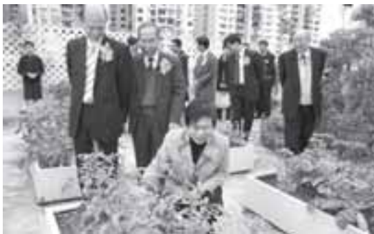
園內植物，郁郁菁菁