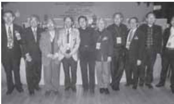
2007年4月獲選為台灣中華全球建築學人交流協會理事長