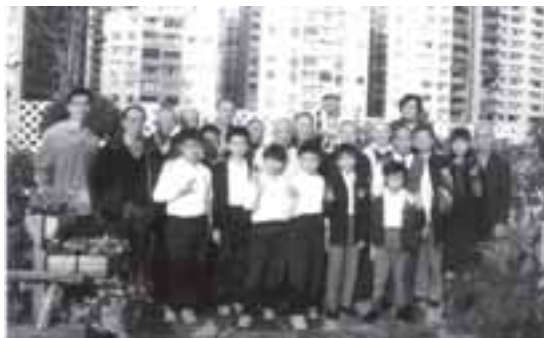
在園內上了一堂充實的環保種植課