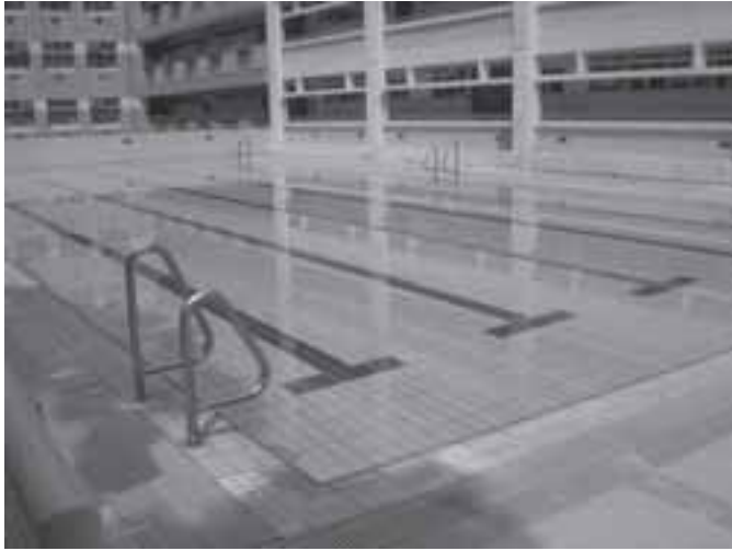
加設上蓋前之露天泳池