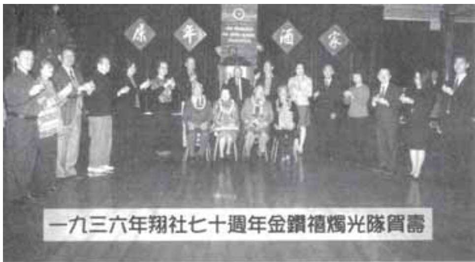
一九三六年翔社七十週年金鑽禧燭光隊賀壽

朝回日日典春衣，每日江頭盡醉歸。 酒債尋常行處有，人生七十古來稀。 穿花蝴蝶深深見，點水蜻蜓款款飛。 傳語風光共流轉，暫時相賞莫相違。