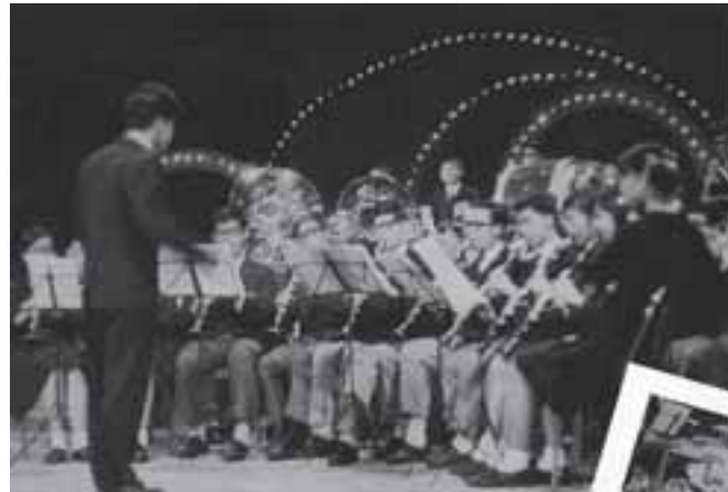
銀樂隊五度蟬聯校際音樂節冠軍 無線電視邀約演出 (1970年)