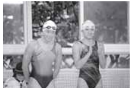
香港游泳代表隊泳式示範嘉賓