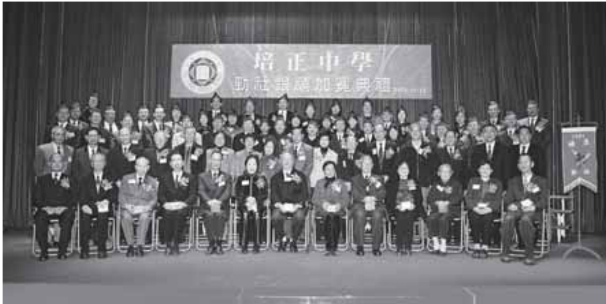
勁社銀禧加冕後師生嘉賓大合照

十二月廿三日(星期六)舉行。是日下午二時半，校友們陸續返抵母校。當日校園內非常熱鬧，四周展出了中學壁報比賽的作品，中學生亦為幼小同學預備了別具特色的園遊攤位，操場中央正舉行「慶祝澳門特別行政區成立七周年音樂會」，除了精彩的管弦樂演出外，還有歌詠、舞蹈等節目，吸引眾人駐足圍觀。