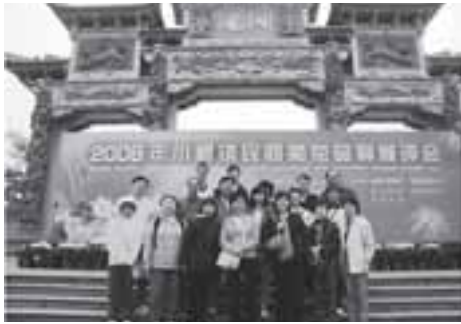
中山小欖菊花展在廣東省很有名，可惜我們來到的時候已臨近展期之末。

由於有「銀禧加冕」的籌備經驗，畢業三十週年的「珍珠禧」慶祝活動，對於我們來說可算「駕輕就熟」；因此，在半年的籌備工作後，我們基本上按著計劃完成。我們這次的慶祝活動共分三個部分：十二月九日、十日到中山、珠海、澳門作兩天遊；十二月十六日參加同學會舉辦的加冕活動和大公宴；十二月十七日則乘坐「昂坪360」纜車到昂坪暢遊寶蓮寺和遠足至大澳。各同學因應自己的時間，各適其適，參加了部分或全部活動，但無論出席人數的多寡，大家臉上都