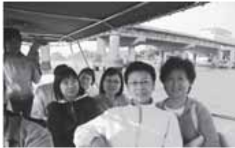
乘船遊覽「江南水鄉」，別有風味。

充滿愉快的笑容，畢竟能與相識超過三十年、一同成長、一同學習、一同嬉戲的老同學再一次同遊，心情是相當愉快的。十二月九日，星期六，早上八時，十五位同學及三位「社嫂」於中港碼頭齊集後，便踏上為期兩天的旅程，同時也正式展開慶祝活動的序幕。在三個多小時的船程和車程後，我們首先參觀了著名的中山小欖菊花展；可惜我們到來的時間已屆展期之末，只能看見眾多曾經燦爛奪目、造型獨特的名菊的「晚景」，和偶爾通過時間考驗的遲來