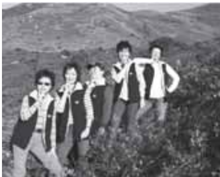
顛倒眾生的捷社美人。