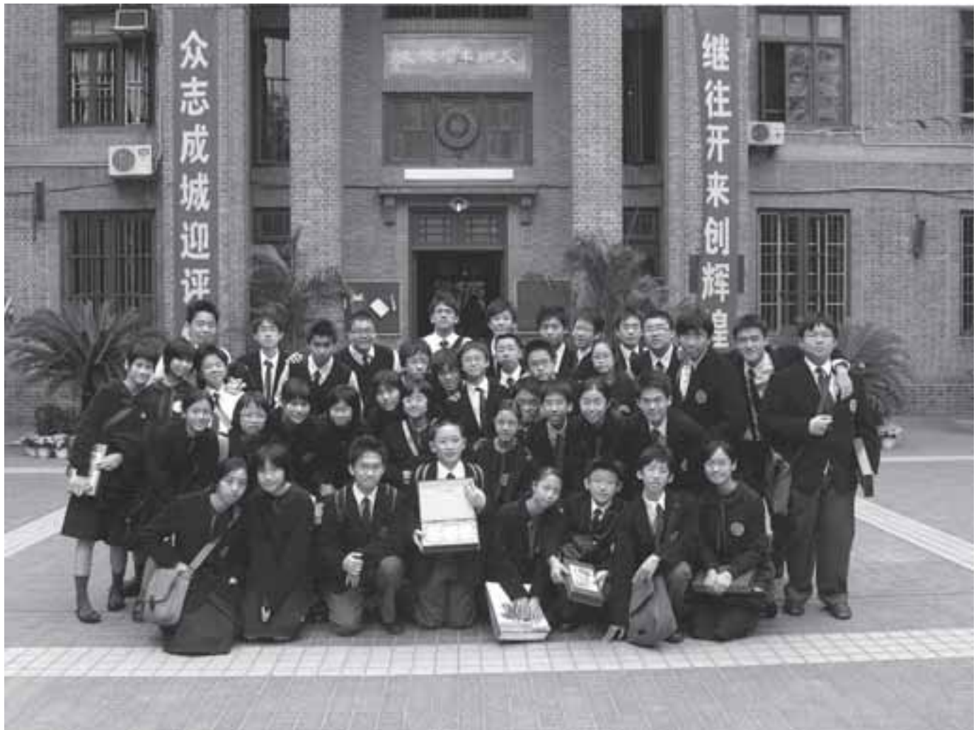
香港培正中學校銀樂隊 (攝於廣州培正中學校2006年)