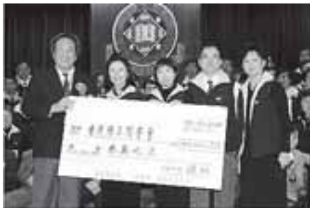
大家努力為母校籌得有紀念性的七十六萬元。