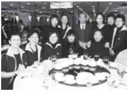
同學日大公宴是全日活動的最高潮。