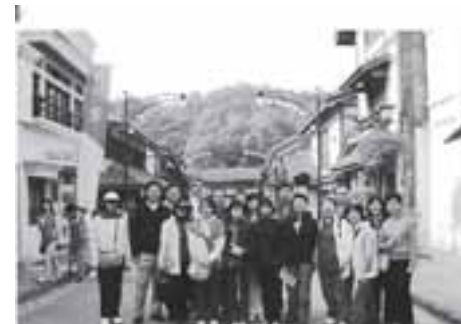
在中山影視城中遊覽有如穿梭於時空之中