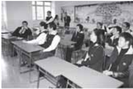
參觀新校舍，恢復三十多年前的學生身份。