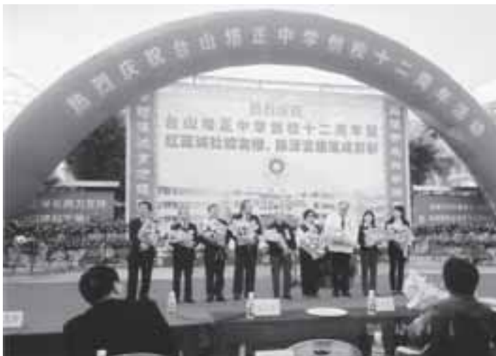
穗、港、澳母校及同學會首長獻辭

接着穗、港培正中、小學及同學會代表向台園林酒店下榻。午餐後，全團校友師生去到台山培正中學，參加建校十二周年校慶暨紅藍誠社校友富樓落成剪綵慶典。進入校園只見幼兒園、小學、中學同學夾道歡迎嘉賓蒞臨，「歡迎！歡迎！」之聲，夾着舞獅的鑼鼓聲，不絕於耳，場面熱烈。