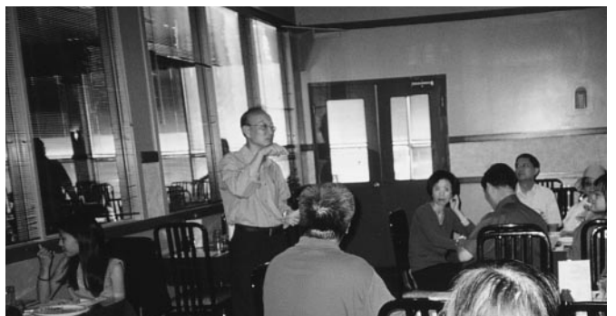
渥太華餐聚。程慶生會長致辭