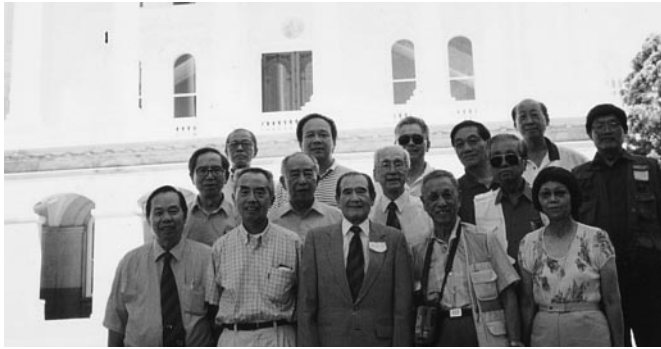
與二埠校友們合影於加省省議會前