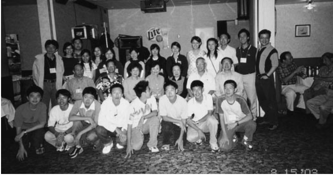
與西雅圖校友們歡聚