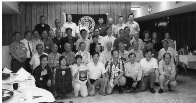
與芝加哥同學歡聚