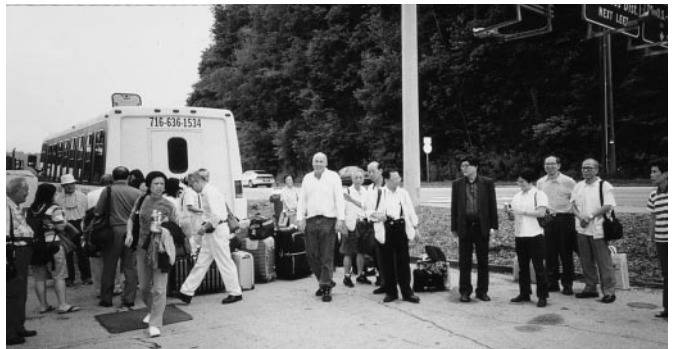
司機：抱歉！車壞了。結果等了四個小時換車繼續行程