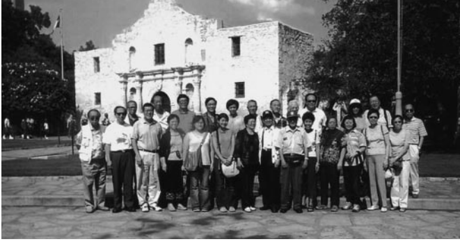
在聖安東尼參觀抗敵古堡