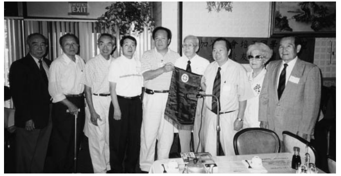
二埠羅根合會長(右三)接受香港同學會贈旗