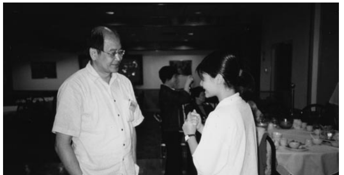
拜見蕭蔭棠數學大師