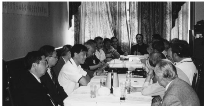
世界各地會長會議訂「加拿大同學日」大會宣言，支持母校取回校名