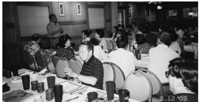
與大湖區校友聚會