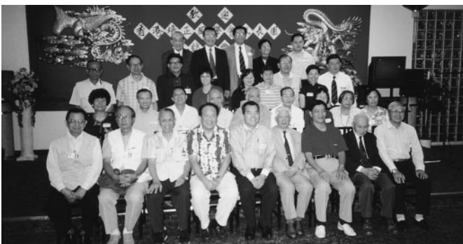
多倫多歡迎會合照