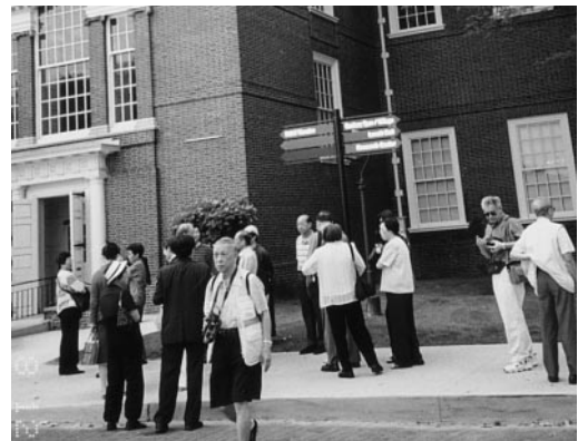
參觀底特律的福特汽車博覽館