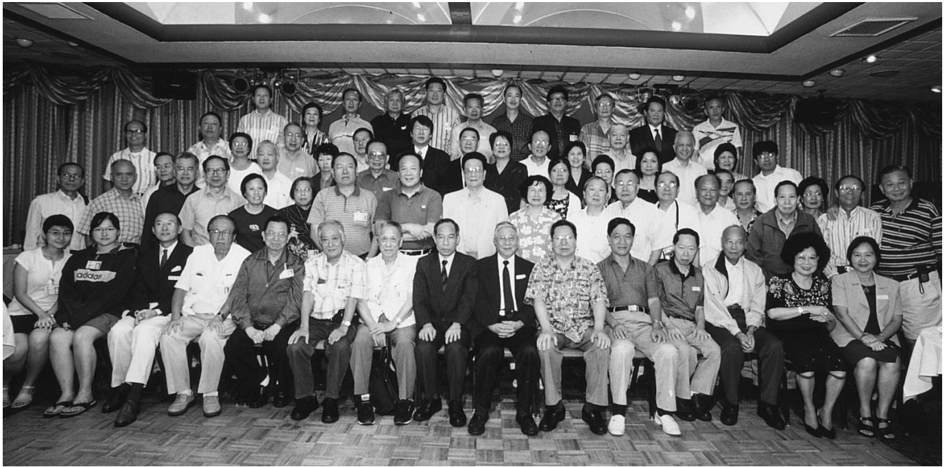
與紐約同學歡聚後來個大合照