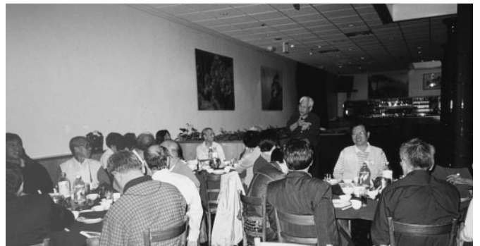
三藩市余光源會長致歡迎辭