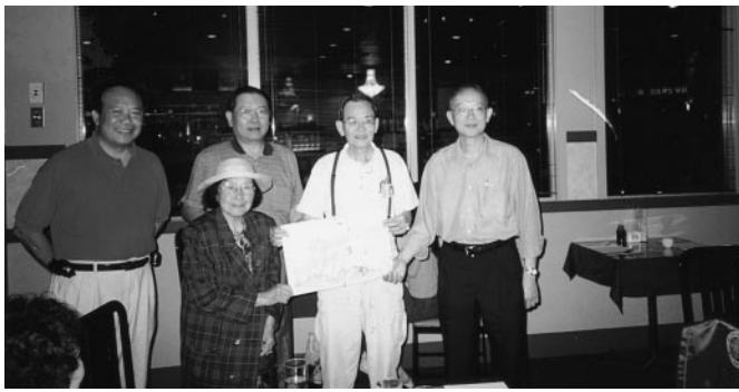
包以文老師親繪彩畫以贈送香港同學會