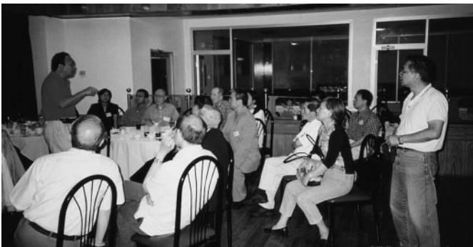
波士頓的同學關心「校名事件」的進展