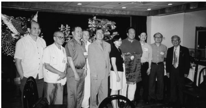
贈旗予波士頓。白甘霖會長(右五)接受