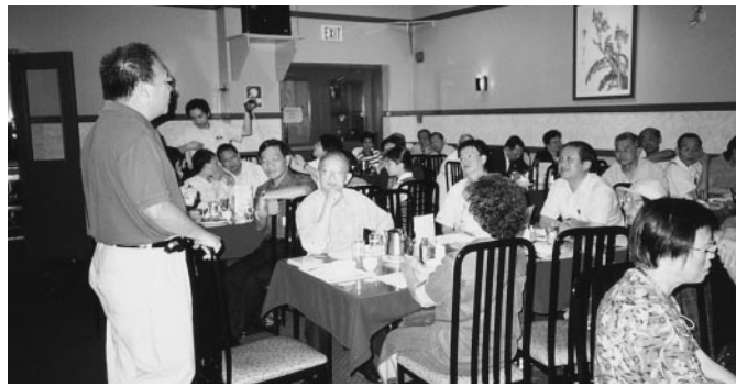
渥汰華歡聚。雷禮和副會長報告校名事件最新發展