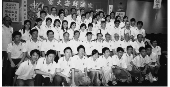
參加首屆全加同學日的香港代表團