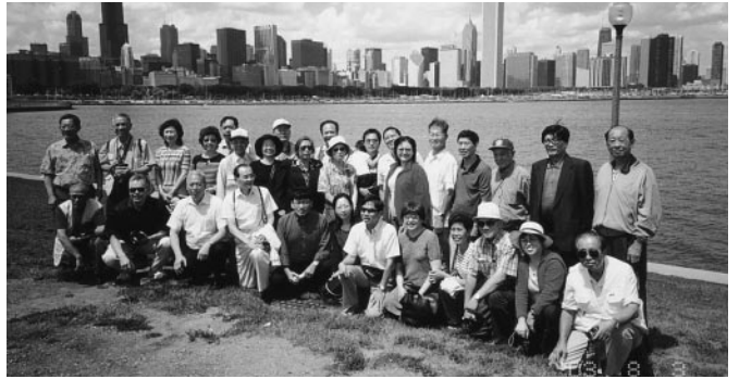
美麗的芝加哥港灣