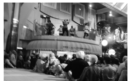
第六晚五樓 BoardWalk之街頭表