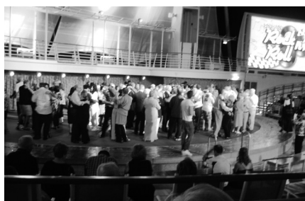
深夜船尾露天舞池熱鬧場面