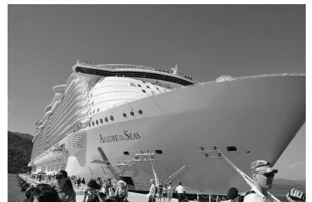
Allure Of The Seas 雄姿