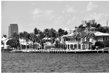
Fort Lauderdale 豪宅

二月廿六日至三月四日是乘郵輪遊西加勒比海，此次旅遊的主菜。此次是一次非正式的團聚，我們不舉行任何儀