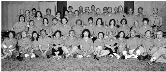
Allure of the Sea Caribbean Tour Feb 2012