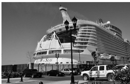
Allure Of The Seas 船尾甚美觀，亦可見其宏偉

此輪屬RoyalCaribbeanCruiseLines，於2010年首航，排水量220,000噸，船身長1181呎，載客量5400人，船員2150人，設備豪華先進。船高17層，有大泳池左右各一，小泳池多個；衝浪池兩個；高空滑索一道；攀山牆一幅；籃球場兩個；乒乓球場兩個共6枱；高爾夫小練習場一個；賭場、