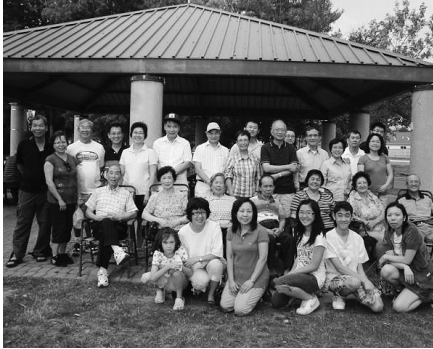
2011年7月11日在加京渥太華的 Andrew Haydon park 舉行夏日燒烤聚會大合照