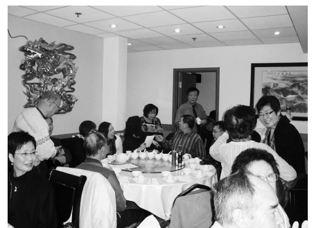
各同學互相問候，樂也融融