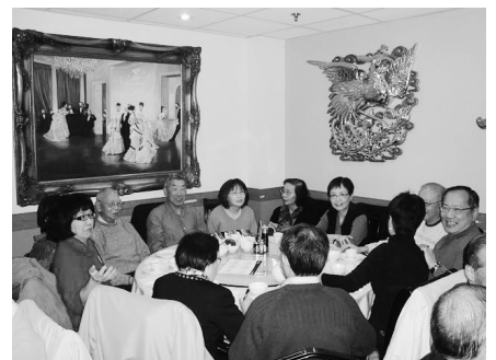
大家都談笑風生，笑口常開