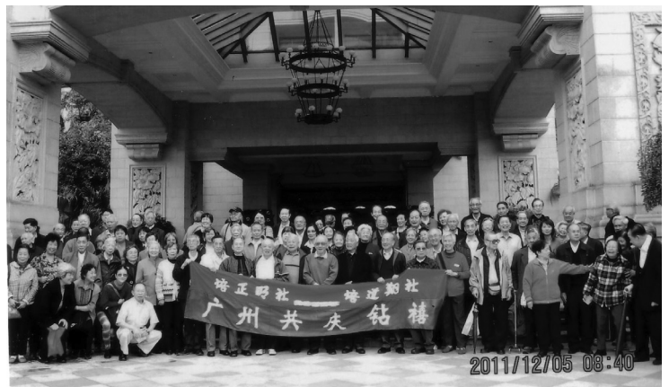
2011年於廣州碧桂園鳳凰城酒店培正明社、培道翔社聯合共慶鑽禧