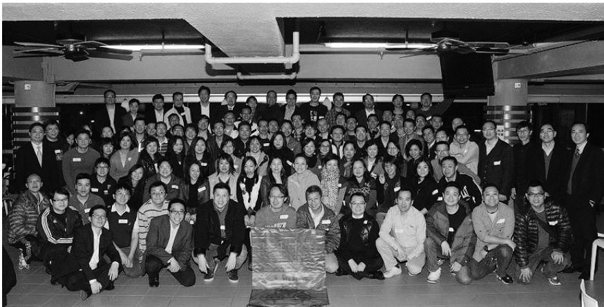
加冕前夕的飯堂派對