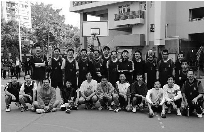
晶社籃球壯丁隊員