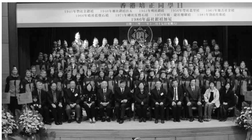
等了廿五載的銀禧加冕