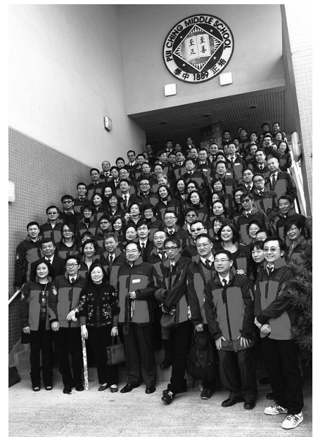
校徽下的紅藍兒女