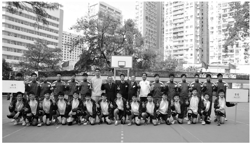
培正四校立方盃排球賽，港、澳校球隊

禧慶活動的級社甚多，今年大公宴共筵開七十多席。雖然各級社分枱而坐，但因培正同學愛好活動，大多與其他級社的同學認識；而且留班是培正的優良傳統，不少同學屬幾朝元老，更是相識滿天下，老友見面，自然有說不盡的話題。