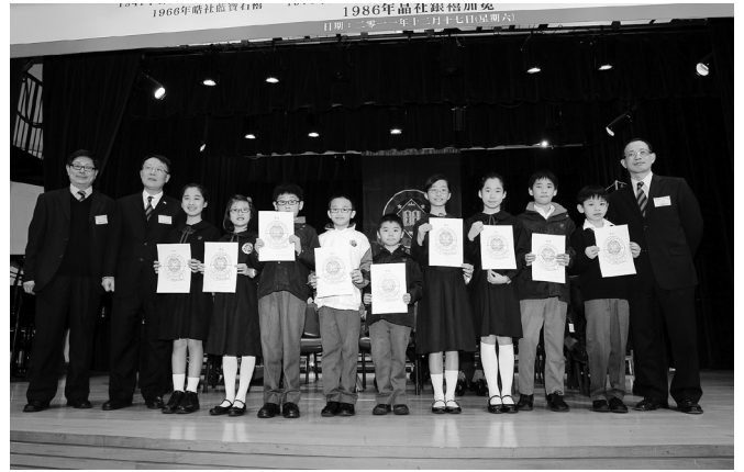
南太獎學金獲獎者合照