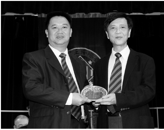
培正四校立方盃排球賽致送紀念碟予台山培正