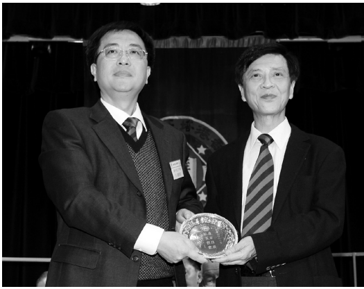
培正四校立方盃排球賽致送紀念碟予廣州培正