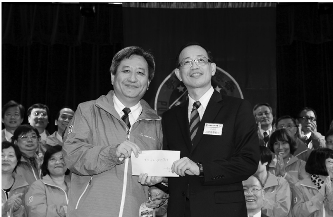
剛社紅寶石禧獻禮