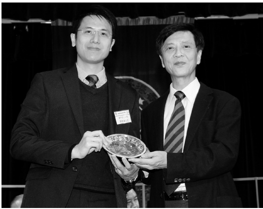
培正四校立方盃排球賽致送紀念碟予澳門培正