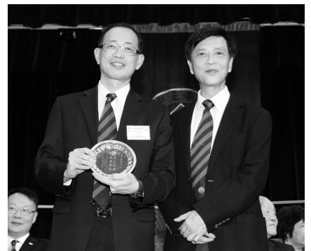
培正四校立方盃排球賽致送紀念碟予香港培正