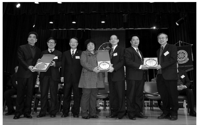
台山培正致送紀念品予港校及同學會