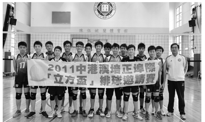
培正四校立方盃排球賽，香港培正球隊