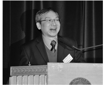
葉賜添校長校務報告